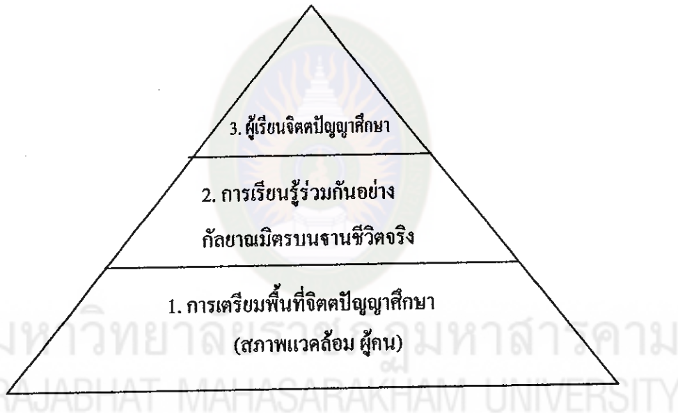
แผนภาพที่ 7 แสดงเส้นทางการเรียนรู้ของผู้เรียนตามแนวทางจิตปัญญาศึกษา โรงเรียนปทุมรัตน์ศึกษามหาวิทยาลัยราชภัฏวชิรวิทยาคาร

จากการถอดบทเรียนเพื่อประเมินคุณภาพผู้เรียนที่ผ่านการพัฒนาด้านแนวทาง จิตปัญญาศึกษาของโรงเรียนปทุมรัตน์ศึกษามหาวิทยาลัยราชภัฏวชิรวิทยาคารตามแนวทางจิตปัญญาศึกษา ซึ่งแสดงแผนที่เส้นทางการการเรียนรู้ได้ดังนี้