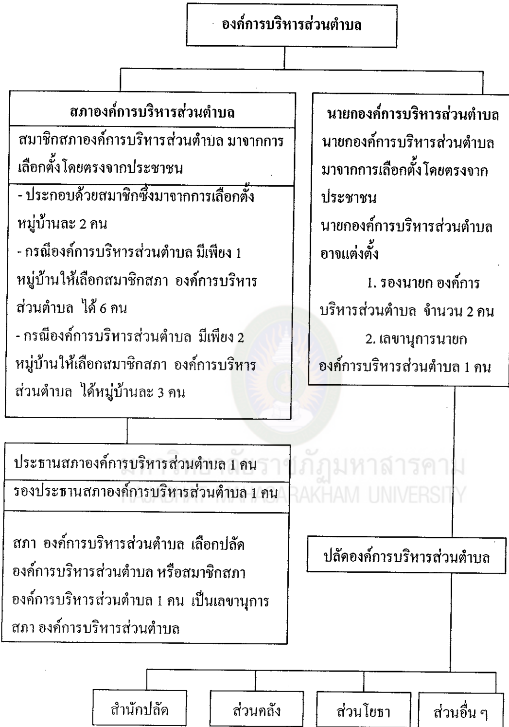
แผนภูมิที่ 2 โครงสร้างองค์การบริหารส่วนตำบล

ที่มา : พระราชบัญญัติสภาตำบล และองค์การบริหารส่วนตำบล พ.ศ. 2537 แก้ไขเพิ่มเติมถึงฉบับที่ 5 พ.ศ. 2546