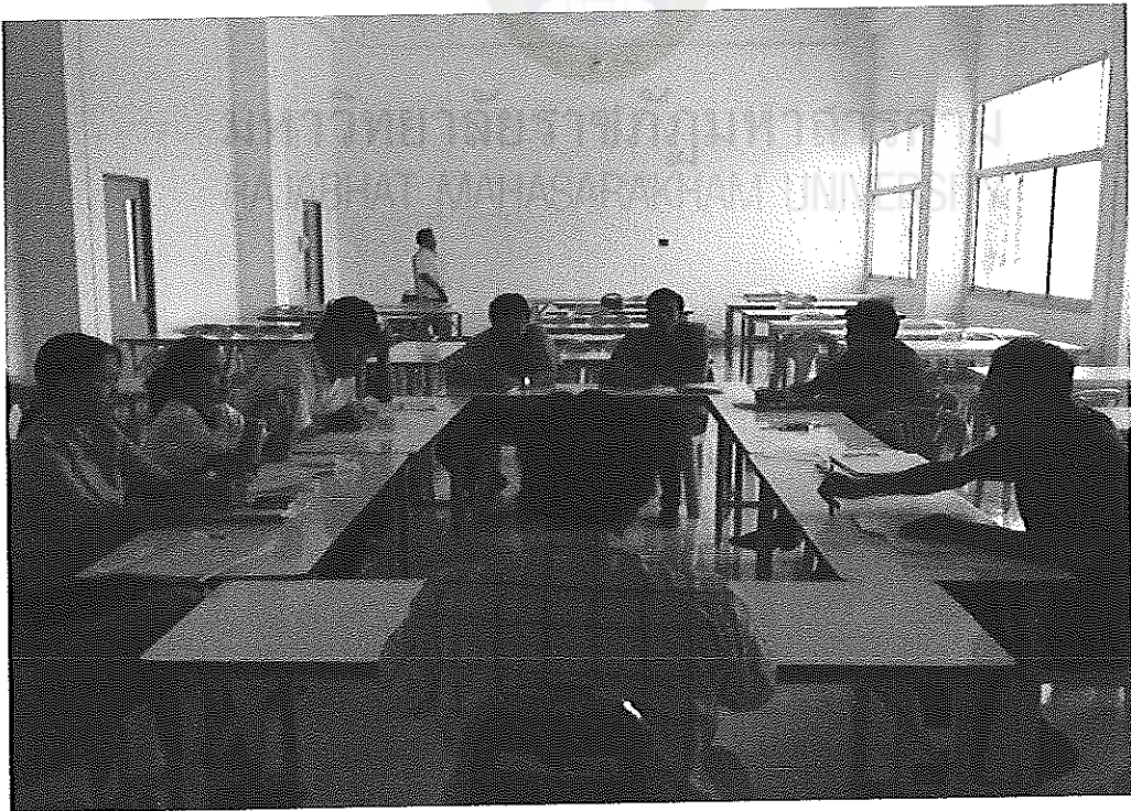
ภาพภาคผนวกที่ 6 การประชุมเพื่อประเมินผลการพัฒนาคุณลักษณะอันพึงประสงค์ของนักเรียน นักศึกษา