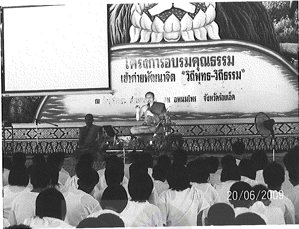
ภาพภาคผนวกที่ 1 เข้าค่ายพัฒนาคุณธรรมจริยธรรม