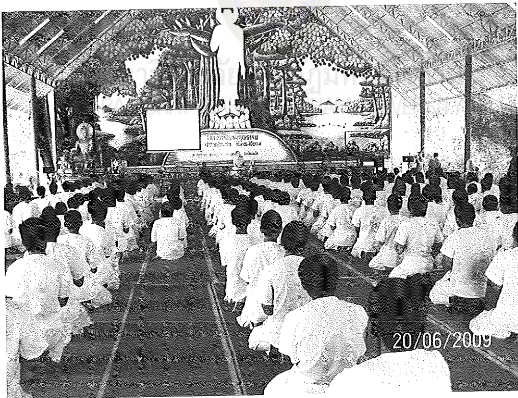
ภาพภาคผนวกที่ 2 เข้าค่ายพัฒนาคุณธรรมจริยธรรม