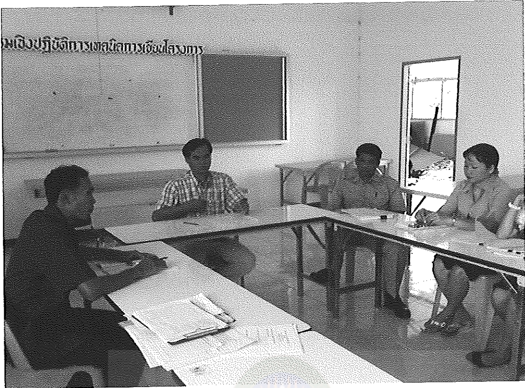
ภาพภาคผนวกที่ 5 การประชุมเพื่อประเมินผลการพัฒนาคุณลักษณะอันพึงประสงค์ของนักเรียน นักศึกษา