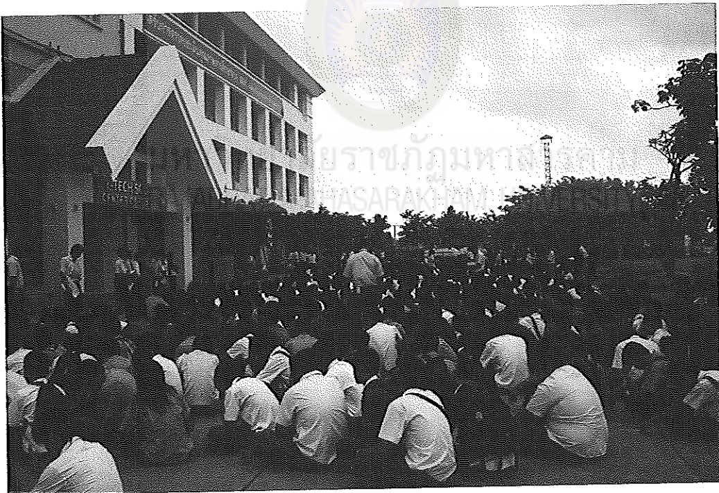
ภาพภาคผนวกที่ 4 การอบรมหน้าเสาธงประจำวัน