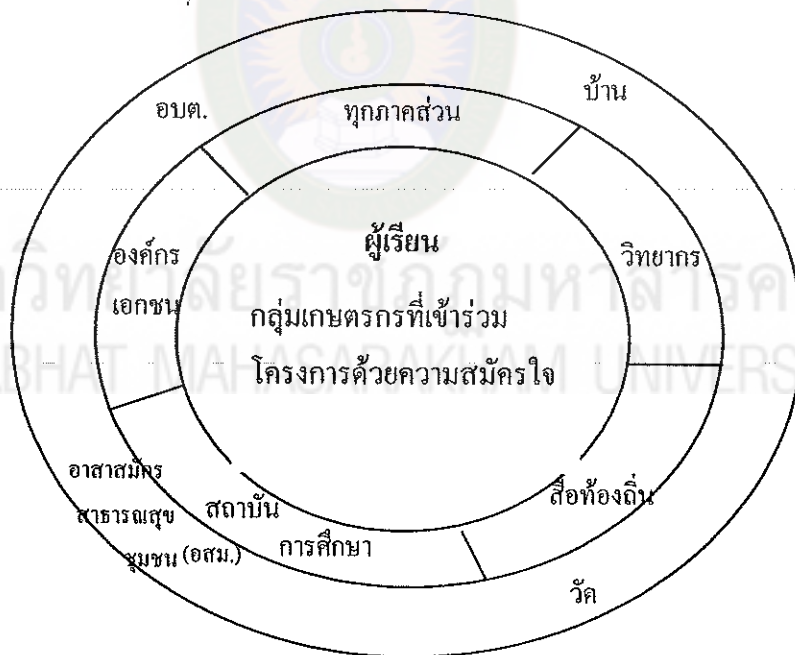
บุคคล องค์กร ชุมชน และสังคม สนับสนุนการเรียนรู้ของผู้เรียน

องค์กรชุมชนตามกรอบแนวคิดการวิจัยจะประกอบด้วย องค์กรผู้ปกครอง เด็ก เยาวชน ประชาชน ปราชญ์ชุมชน อสม. และ อบต. ที่สมัครใจเข้าร่วมโครงการเป็นกลุ่ม เกษตรกร และสถาบันการศึกษา นักวิชาการ ผู้เชี่ยวชาญ องค์กรเอกชน และองค์กรอื่น ๆ ภายนอกชุมชน ซึ่งทุกองค์กรมีสิทธิและอิสระในการจัดการศึกษาที่เชื่อมโยงกันได้ทั้ง การศึกษาในระบบ การศึกษานอกระบบ การศึกษาตามอัธยาศัยและการเรียนรู้ตลอดชีวิตให้ ผู้เรียนจากกลุ่มเกษตรกรได้เรียนรู้อย่างมีความสุขเต็มตามศักยภาพ รู้ท้องถิ่น รู้รากเหง้า รู้ ประวัติศาสตร์ รู้อาชีพบรรพบุรุษ รู้วิชาชีพ เพิ่มเติม เพื่อเป็นพลเมือง พลโลกที่ดี มีปัญญา สัมมาอาชีพ มีคุณธรรมสร้างสันติสุข นำชุมชนไปสู่ความสงบสุข เกิดชุมชนพึ่งตนเองใน ระดับครัวเรือนและระดับกลุ่มการผลิต โดยพึ่งตนเองเรื่องเทคโนโลยี เศรษฐกิจ จิตใจ ทรัพยากรและสังคมวัฒนธรรม มีหลักสูตรสัมมาอาชีพของตนเองในด้านการประกอบอาชีพ ดังแผนภาพ