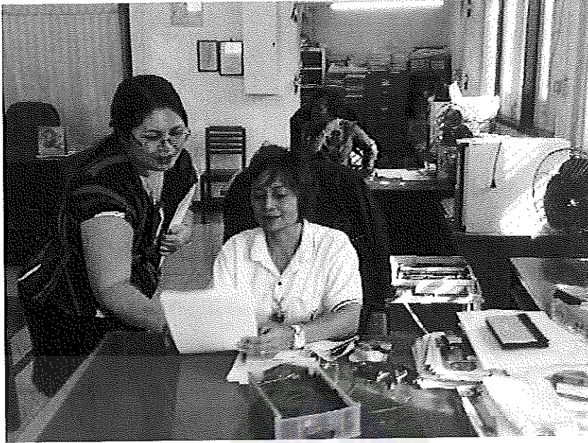
ภาพประกอบที่ 3 การเก็บข้อมูลเพื่อการศึกษา ณ สำนักงานยาสูบหนองคาย วันที่ 22 เมษายน 2554