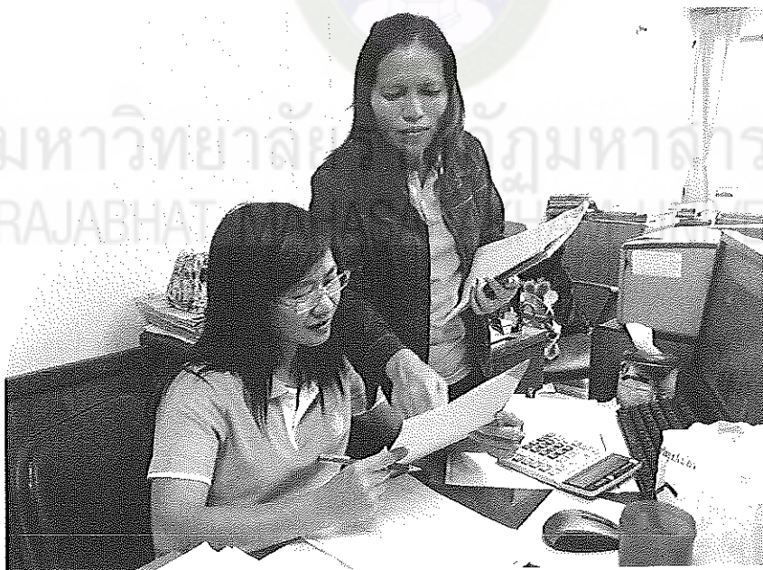
ภาพประกอบที่ 6 การเก็บข้อมูลเพื่อการศึกษา ณ สำนักงานยาสูบบ้านไผ่ วันที่ 25 เมษายน 2554