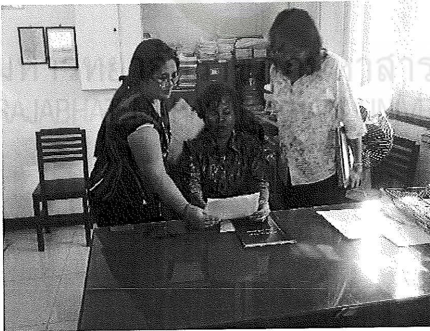
ภาพประกอบที่ 4 การเก็บข้อมูลเพื่อการศึกษา ณ สำนักงานยาสูบหนองคาย วันที่ 22 เมษายน 2554