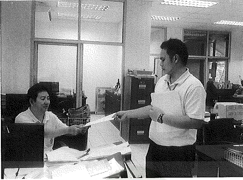
ภาพประกอบที่ 9 การเก็บข้อมูลเพื่อการศึกษา ณ สำนักงานยาสูบนครพนม วันที่ 26 เมษายน 2554

มหาวิทยาลัยราชภัฏมหาสารคาม RAJABHAT MAHASARAKHAM UNIVERSITY