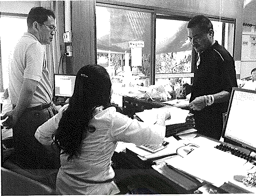
ภาพประกอบที่ 7 การเก็บข้อมูลเพื่อการศึกษา ณ สำนักงานยาสูบบ้านไผ่ วันที่ 27 เมษายน 2554