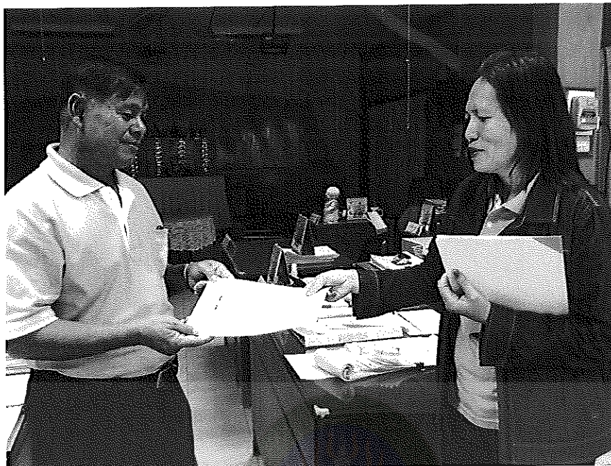
ภาพประกอบที่ 5 การเก็บข้อมูลเพื่อการศึกษา ณ สำนักงานยาสูบบ้านไผ่ วันที่ 25 เมษายน 2554