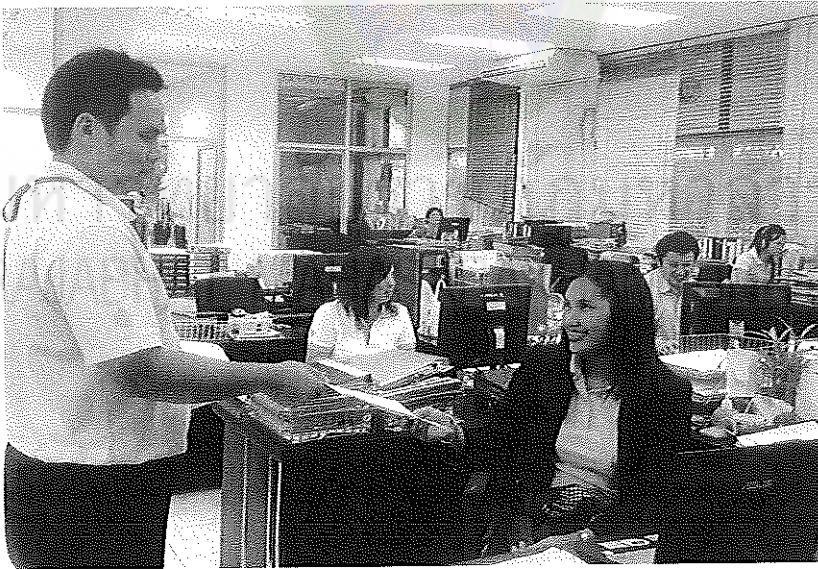
ภาพประกอบที่ 8 การเก็บข้อมูลเพื่อการศึกษา ณ สำนักงานยาสูบนครพนม วันที่ 26 เมษายน 2554