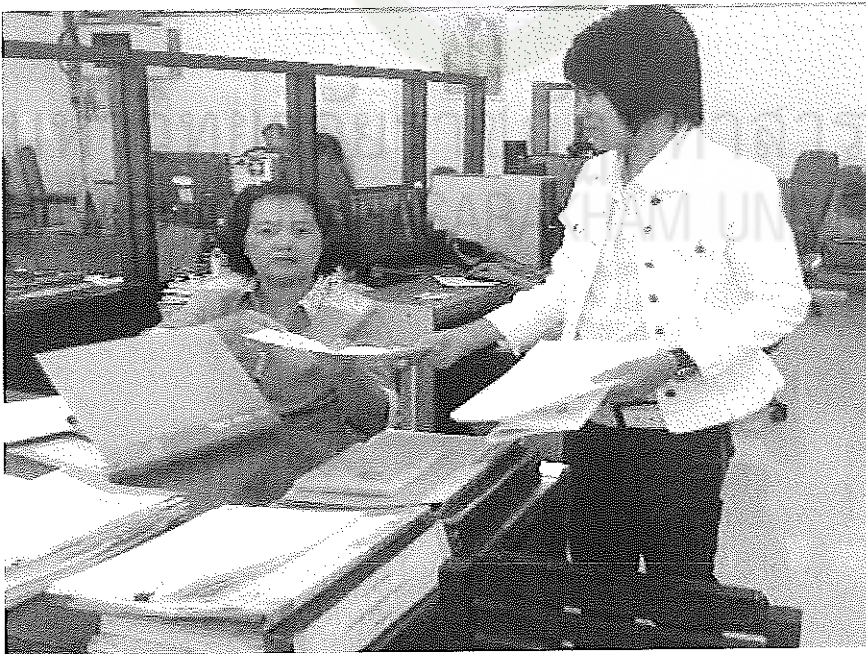
ภาพประกอบที่ 2 การเก็บข้อมูลเพื่อการศึกษา ณ สำนักงานยาสูบหนองคาย วันที่ 20 เมษายน 2554