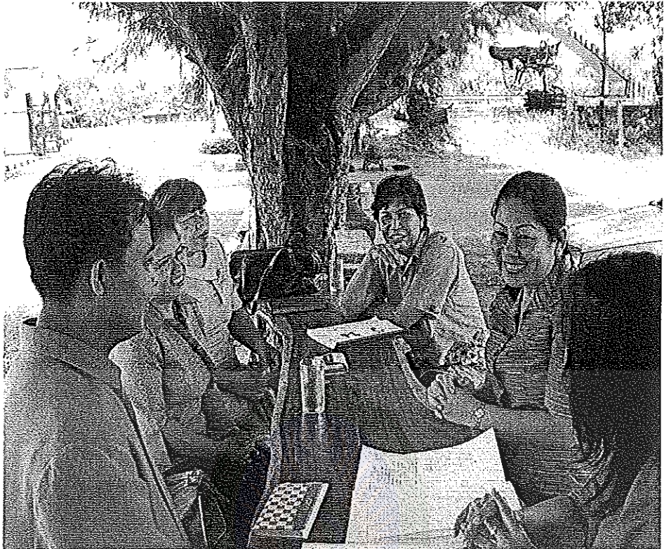
ภาพประกอบที่ 3 การนิเทศภายใน เพื่อการพัฒนาครูด้านการวิจัยในชั้นเรียน โรงเรียนบ้านถิ่น สุขาวิทยา สำนักงานเขตพื้นที่การศึกษาประถมศึกษาอุดรธานี เขต 1 ระหว่างวันที่ 15 กุมภาพันธ์ 2554 ถึง วันที่ 14 มีนาคม 2554

มหาวิทยาลัยราชภัฏมหาสารคาม RAJABHAT MAHASARAKHAM UNIVERSITY