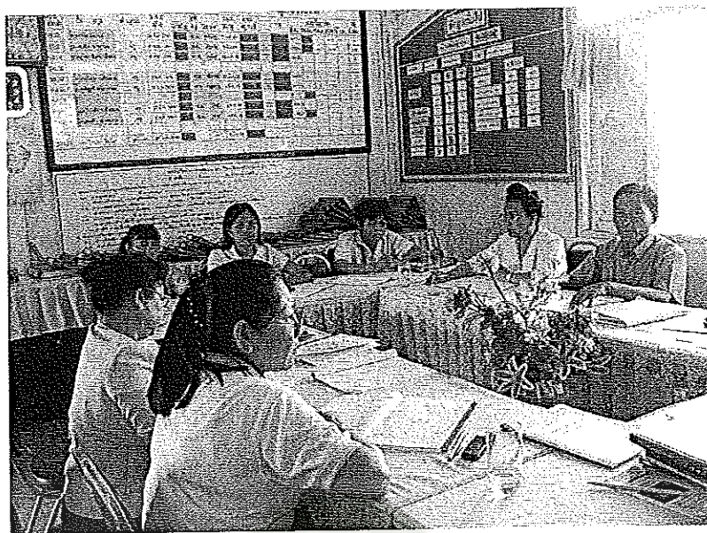
ภาพประกอบที่ 1 พัฒนาคู่มือด้านการวิจัยในชั้นเรียนโรงเรียนบ้านถิ่นสุขาวิทยา สำนักงานเขต พื้นที่การศึกษาประถมศึกษาอุดรธานี เขต 1 ประชุมเพื่อศึกษาสภาพปัจจุบัน ปัญหา (Focus Group) ระหว่างวันที่ 8-12 พฤศจิกายน 2553