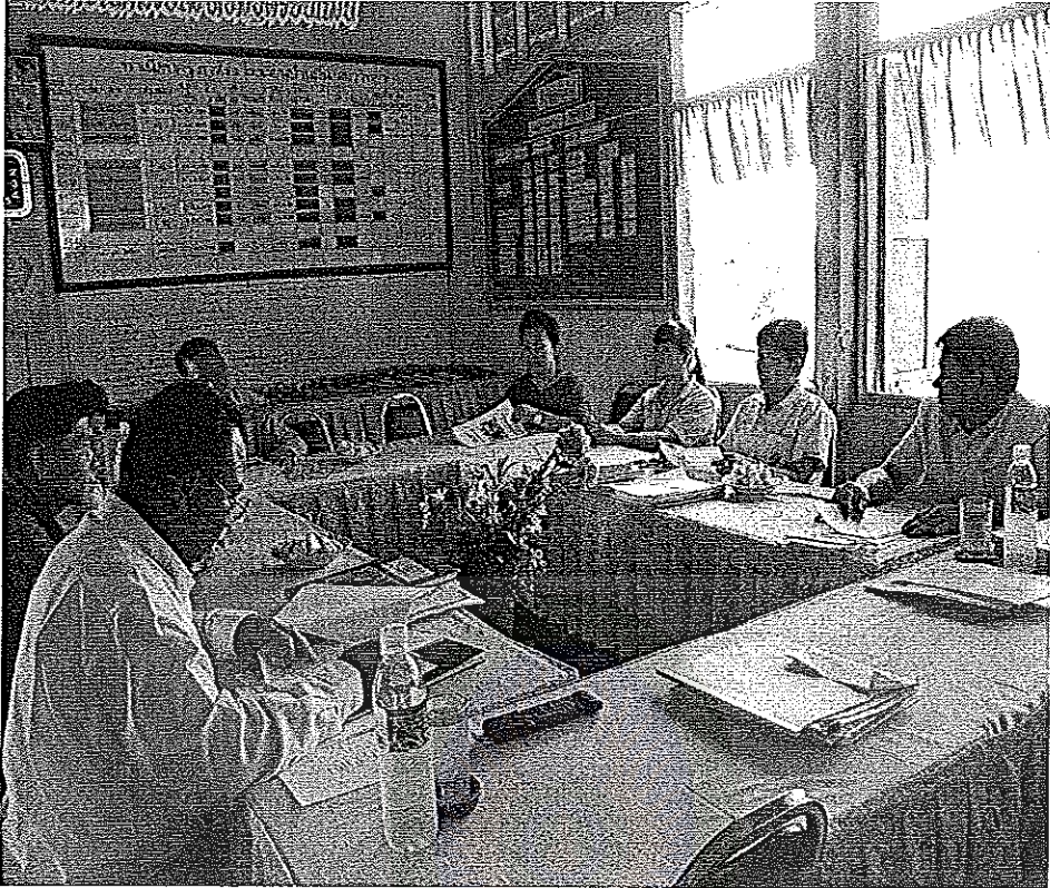
ภาพประกอบที่ 4 ประชุมสรุปผลการพัฒนาครูด้านการวิจัยในชั้นเรียน โรงเรียนบ้านถ้ำ สุขาวิทยา สำนักงานเขตพื้นที่การศึกษาประถมศึกษาอุดรธานี เขต 1 ใน วันที่ 14 มีนาคม 2554

มหาวิทยาลัยราชภัฏมหาสารคาม RAJABHAT MAHASARAKHAM UNIVERSITY