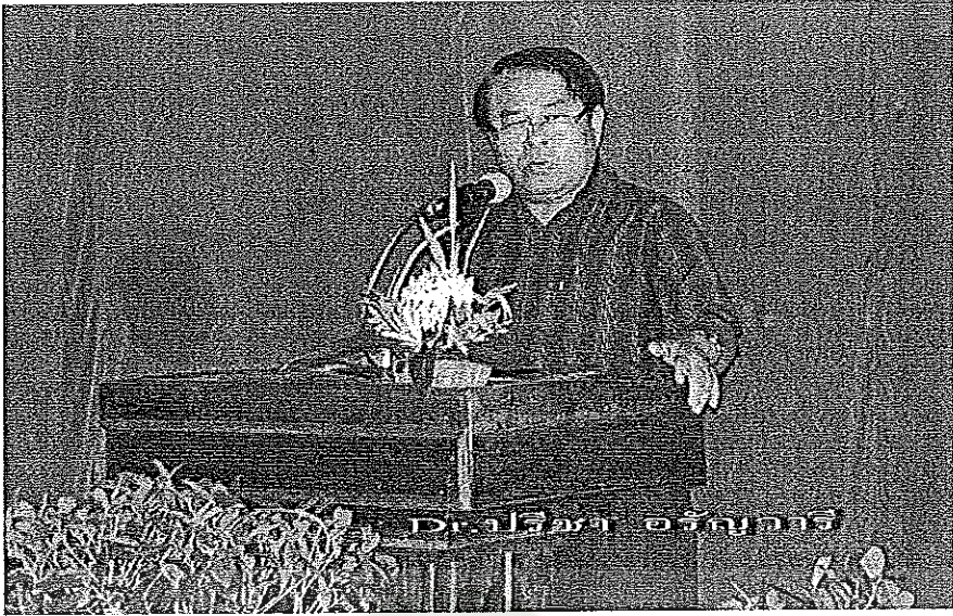
ภาพประกอบที่ 2 การอบรมเชิงปฏิบัติการเพื่อพัฒนาครูด้านการวิจัยในชั้นเรียน โรงเรียน บ้านดั้นสุขาวิทยา สำนักงานเขตพื้นที่การศึกษาประถมศึกษาอุดรธานี เขต 1 ระหว่างวันที่ 25 – 26 พฤศจิกายน 2553