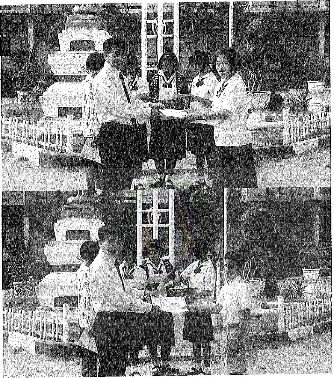
ภาพภาคผนวกที่ 5 กิจกรรมธนาคารความดี