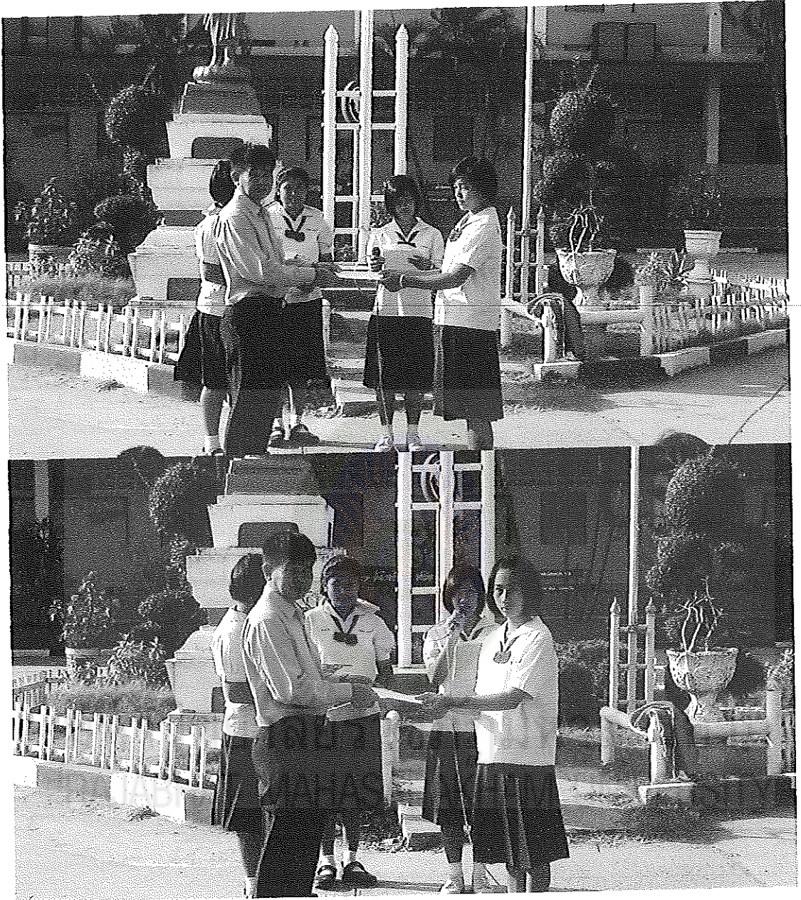
ภาพภาคผนวกที่ 3 กิจกรรมรักการอ่าน