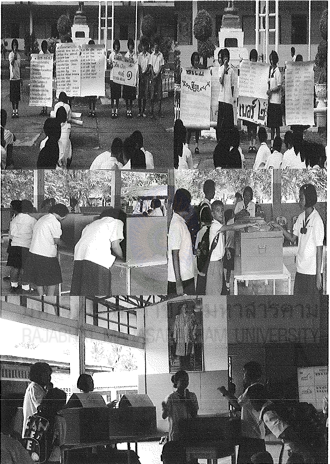
ภาพภาคผนวกที่ 6 กิจกรรมประชาธิปไตยในโรงเรียน