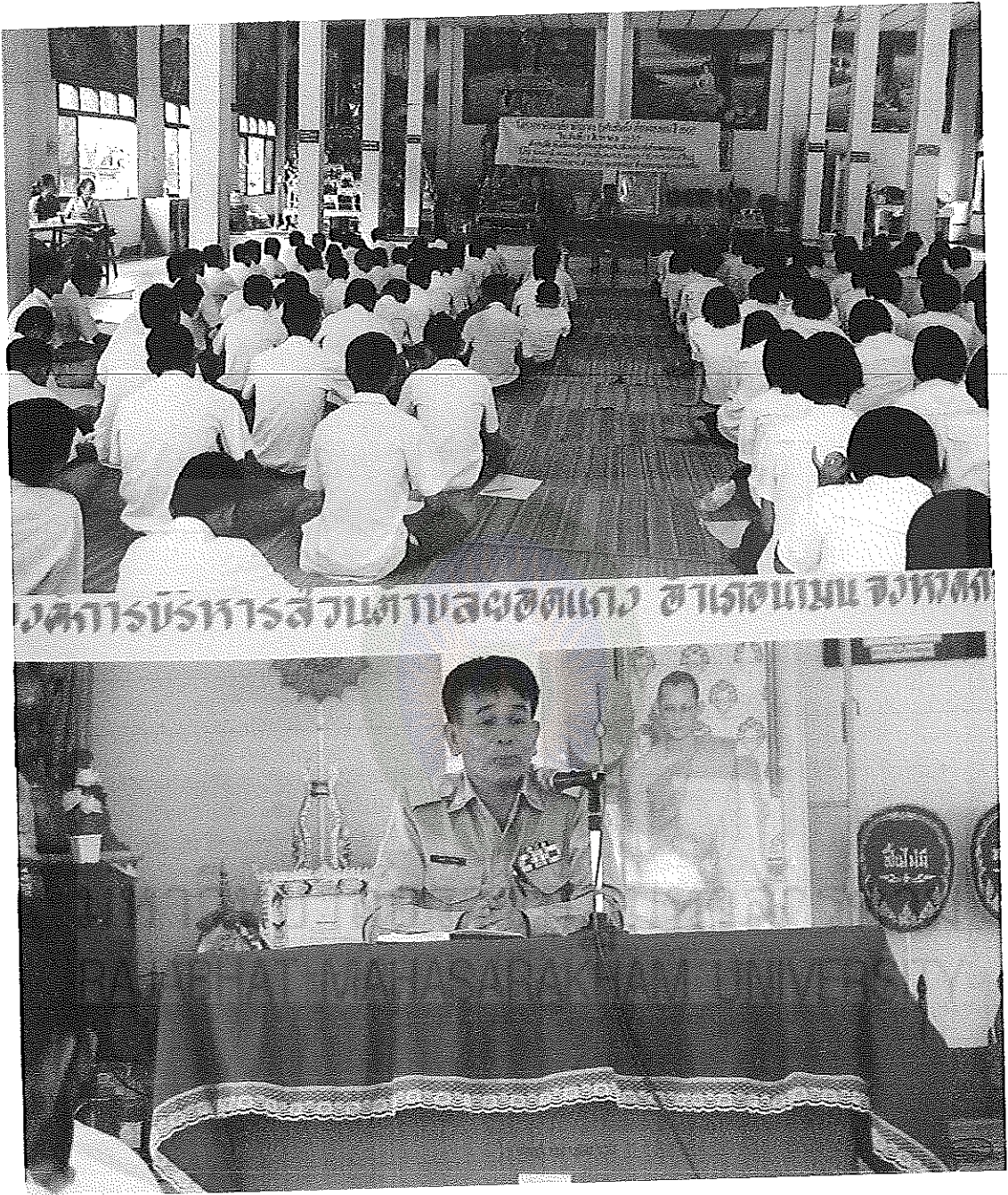
ภาพภาคผนวกที่ 1 กิจกรรมเข้าค่ายจริยธรรม