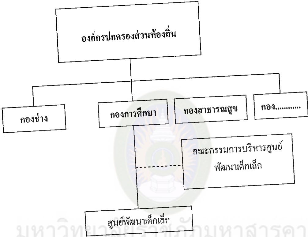
ภาพที่ 3 รูปแบบการจัดตั้งศูนย์พัฒนาเด็กเล็ก (กรมส่งเสริมการปกครองท้องถิ่น, 2547 :10)

องค์กรปกครองส่วนท้องถิ่นมอบหมายให้ผู้ดำรงตำแหน่งบุคลากรทางการศึกษาหรือพนักงานจ้างที่มีคุณสมบัติ เพื่อแต่งตั้งเป็นหัวหน้าศูนย์และแต่งตั้งคณะกรรมการบริหารศูนย์พัฒนาเด็กเล็ก โดยมีหัวหน้าศูนย์ฯ รับผิดชอบการดำเนินงานภายในศูนย์พัฒนาเด็กเล็ก