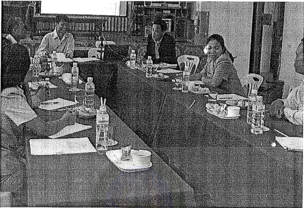
ผู้เข้าร่วมสนทนากลุ่มร่วมอภิปรายตามประเด็นอย่างหลากหลาย