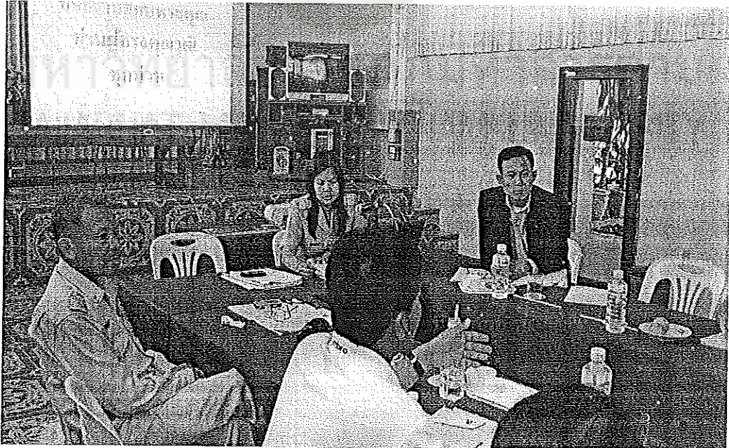
บรรยากาศการสนทนากลุ่ม