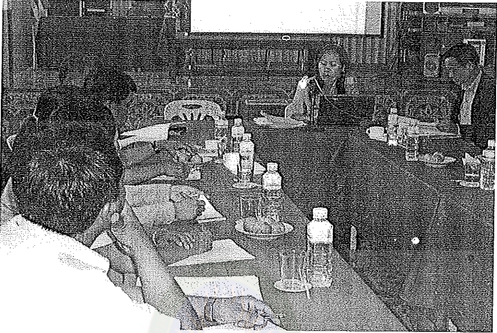
ผู้วิจัยนำเสนอผลการวิจัยที่ได้จากแบบสอบถาม