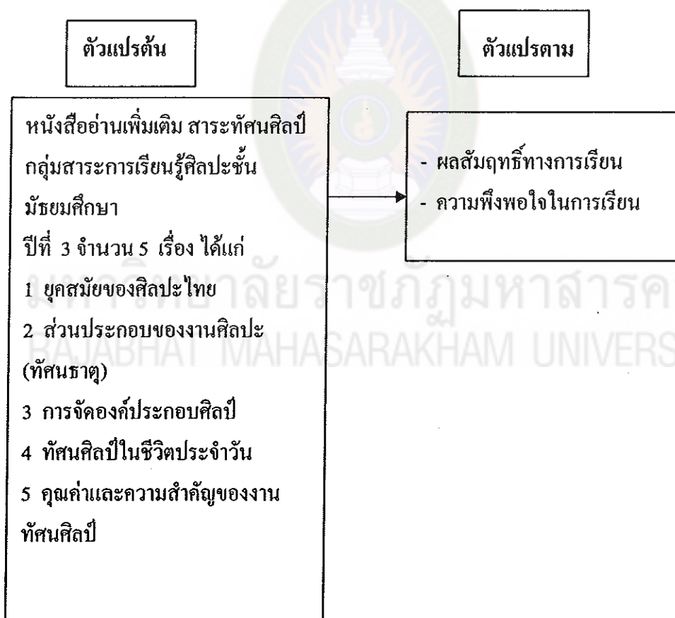
แผนภูมิที่ 1 กรอบแนวคิดในการวิจัย

จากการศึกษาเอกสารและงานวิจัยที่เกี่ยวข้อง จากทฤษฎีจิตวิทยา ผู้วิจัยได้กำหนด กรอบแนวคิดในการวิจัย ได้ดังนี้