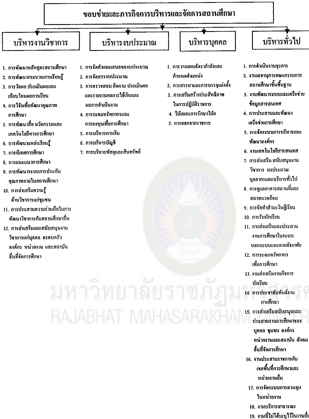
แผนภาพที่ 2 ภาพรวมการจัดการศึกษาของสถานศึกษาขั้นพื้นฐานที่เป็นนิติบุคคล