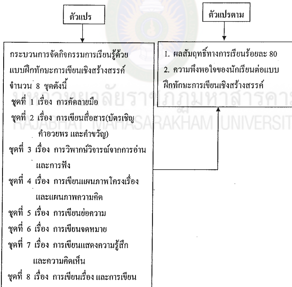
ภาพประกอบที่ 2 กรอบแนวคิดในการวิจัย

การวิจัยครั้งนี้เป็นการวิจัยเชิงทดลอง โดยสร้างแบบฝึกทักษะการเขียนเชิงสร้างสรรค์ ภาษาไทย เพื่อพัฒนาทักษะการเขียนเชิงสร้างสรรค์ นักเรียนชั้นประถมศึกษาปีที่ 5 โรงเรียนบ้านโคกกลาง โดยใช้ทฤษฎีการเชื่อมโยงของธอร์นไคค์ (Thorndike's Connected Theory) ที่กล่าวว่า การเรียนรู้เกิดจากการเชื่อมโยงระหว่างสิ่งเร้ากับการตอบสนองของผู้เรียนในแต่ละขั้นอย่างต่อเนื่อง โดยอาศัยกฎการเรียนรู้ 3 กฎ คือ กฎแห่งความพร้อม (Law of Readiness) กฎแห่งการฝึกหัด (Law of Exercise) และกฎแห่งผลที่ได้รับ (Law of Effect) ซึ่งมีกรอบแนวคิดตามภาพประกอบที่ 2 ดังนี้