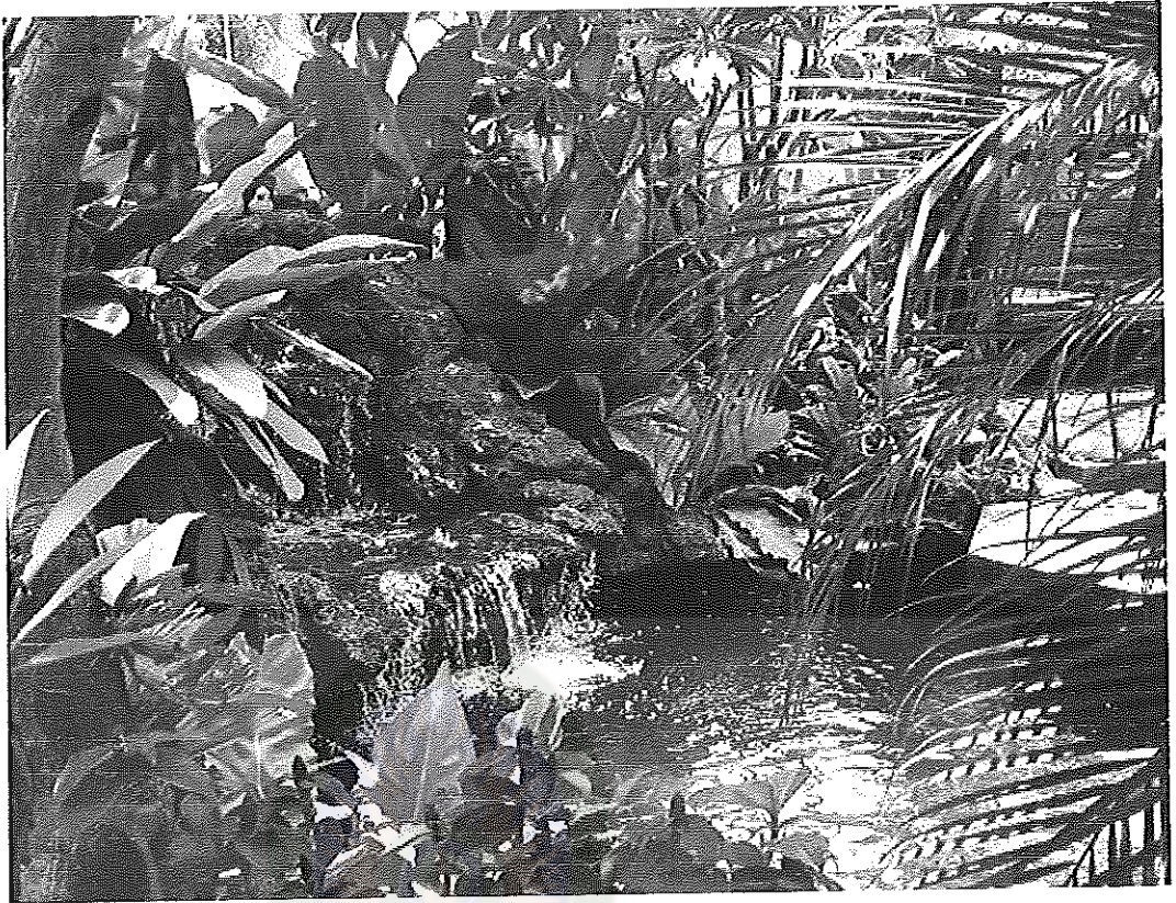
ภาพที่ 10 สวน 4