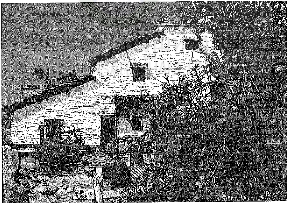
ภาพประกอบ 4 ผลงานจิตรกรรมบาติกที่เกี่ยวข้อง (4) ชื่อศิลปิน เบ็ท แมคคอย อีวาน (Beth McCoy Evan) ชื่อผลงาน อয়ারพานีเฮาส์ (Ayarpani house) เทคนิค บาติก