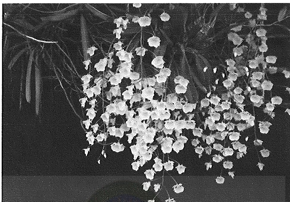
ภาพที่ 18 เอื้องผึ้ง