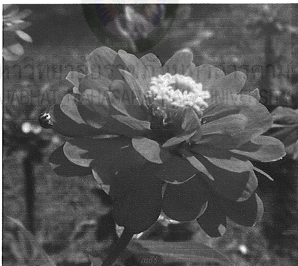
ภาพที่ 19 ดอกบานชื่น