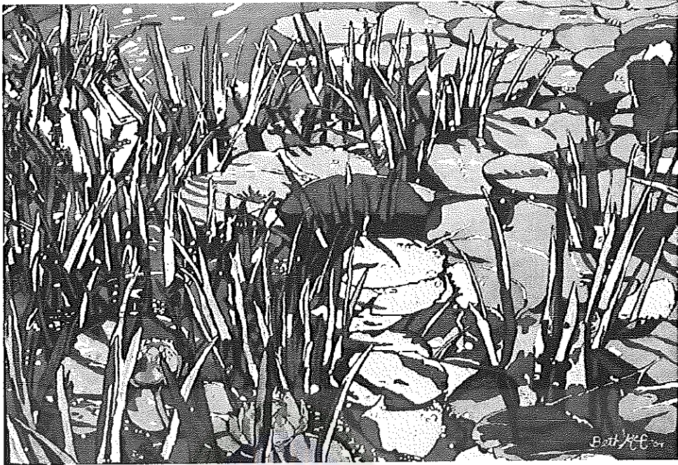
ภาพประกอบ 3 ผลงานจิตรกรรมบาติกที่เกี่ยวข้อง (3) ชื่อศิลปิน เบ็ท แมคคอย อีวาน (Beth McCoy Evan) ชื่อผลงาน พังลิลีปอนด์ (Pink lily pond) เทคนิค บาติก