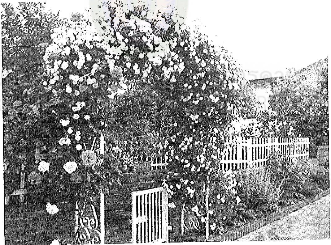
ภาพที่ 7 สวน 1

ความงามในธรรมชาติ เป็นส่วนหนึ่งของฐานศาสตร์ด้านสุนทรียศาสตร์ ดังนั้น “สวน” จึงเป็นศิลปะอย่างหนึ่งที่มีการใช้ธรรมชาติเป็นวัสดุอุปกรณ์สำคัญในการสร้างสรรค์ออกมาให้เป็นสวนแบบใดแบบหนึ่ง และเป็นที่ทราบแล้วว่า สวนมีความผูกพันกับชีวิตมนุษย์มาอย่างยาวนานโดยเฉพาะในด้านการให้สุนทรียภาพแก่มนุษย์เรา ประกอบกับที่ผู้สร้างสรรค์ได้หยิบยกเอาความงามในสวน มาเป็นเนื้อหาสำคัญของการสร้างงานจิตรกรรมบาติก ดังภาพข้อมูลจากภาคสนามบางส่วน ดังนี้