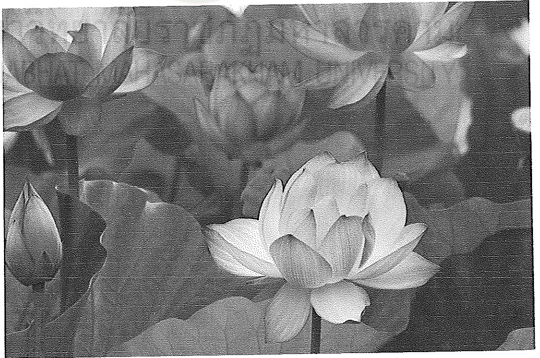
ภาพที่ 11 บัวหลวง