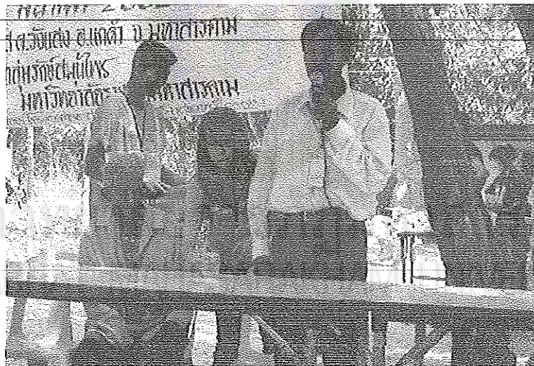
ภาพที่ 4 หนอยาพื้นบ้านให้ความรู้เกี่ยวกับการใช้สมุนไพรรักษาโรคทั่วไป