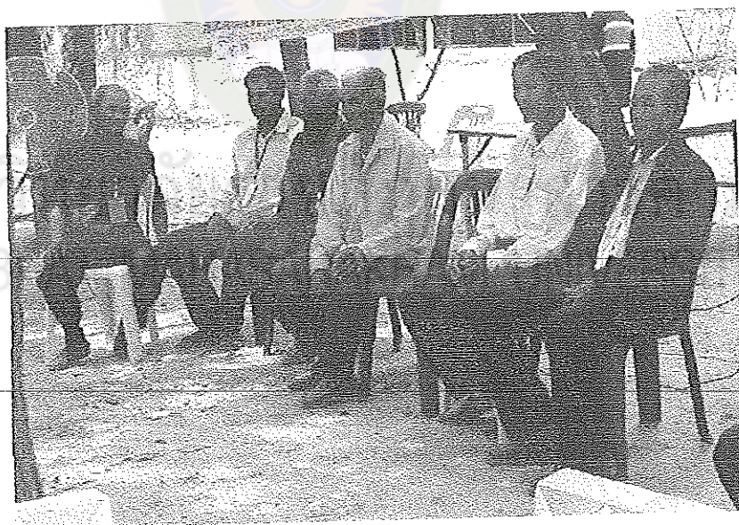
ภาพที่ 2 หมอหย่าที่บ้าน ต.วังแสง อ.แกด้า จ.มหาสารคาม