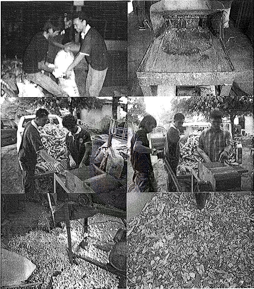
ภาพที่ 3 แสดงการทำน้ำมันสำปะหลังแห้ง (มันเส้น)