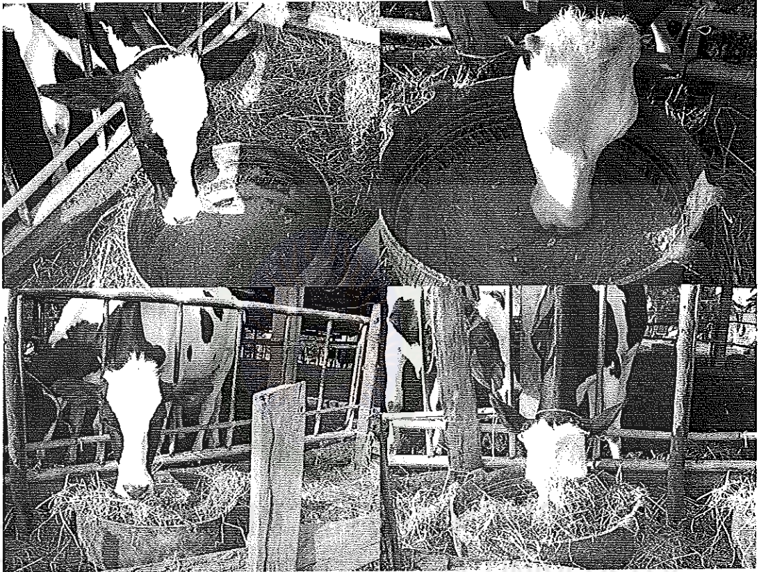
ภาพที่ 4 แสดงการให้อาหารสัตว์ทดลอง