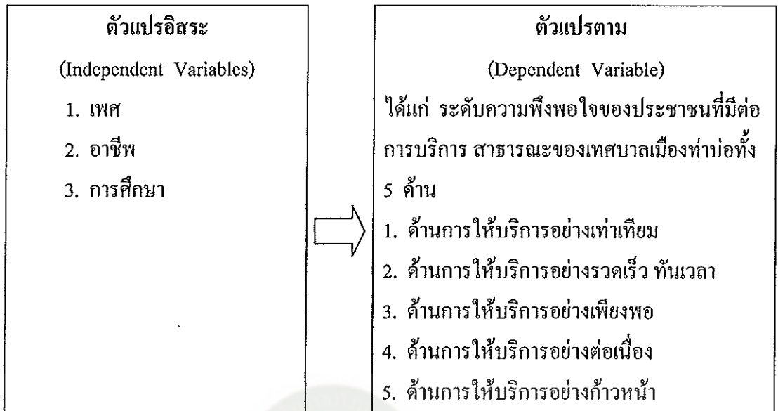
แผนภูมิที่ 4 กรอบแนวคิดในการวิจัย