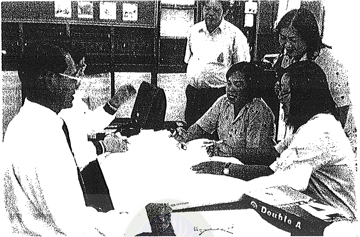
ภาพประกอบที่ 3 ผู้เข้าร่วมประชุมเชิงปฏิบัติการวางแผนร่วมกัน ในการเขียนแผนการจัดการเรียนรู้แบบ โครงงาน