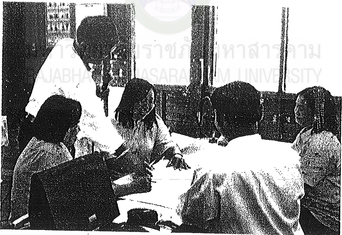
ภาพประกอบที่ 6 วิทยากรชี้แนะแนวทางในการปรับปรุงข้อบกพร่องในการเขียนแผน การจัดการเรียนรู้แบบ โครงงานให้กับผู้เข้าร่วมประชุมเชิงปฏิบัติการ