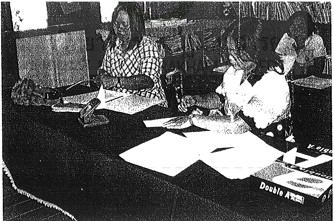
ภาพประกอบที่ 4 ผู้เข้าร่วมประชุมเชิงปฏิบัติการลงมือปฏิบัติ เขียนแผนการจัดการเรียนรู้แบบ โครงงาน