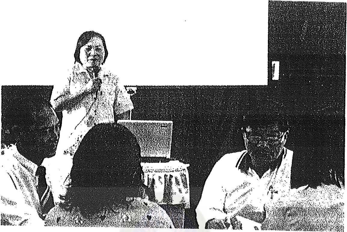
ภาพประกอบที่ 5 ผู้เข้าร่วมประชุมเชิงปฏิบัติการและวิทยากรร่วมแลกเปลี่ยนความคิดเห็น การจัดการเรียนรู้แบบ โครงงาน