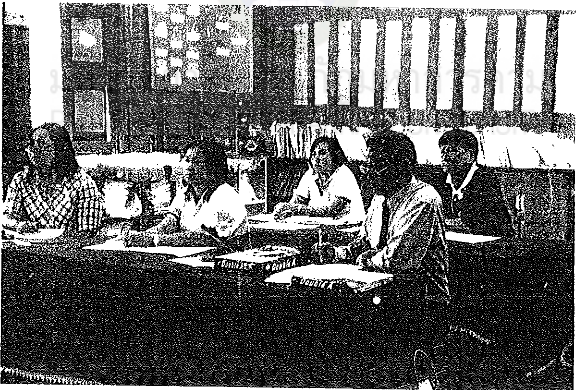
ภาพประกอบที่ 2 ผู้เข้าร่วมประชุมเชิงปฏิบัติการกำลังตั้งใจฟังคำบรรยายจากวิทยากร