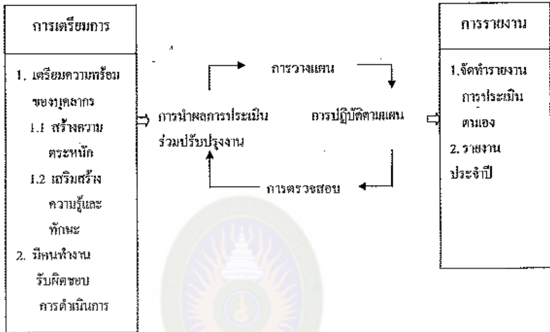
ภาพที่ 2 แผนภูมิขั้นตอนการดำเนินการประกันคุณภาพภายในสถานศึกษา

สำนักงานคณะกรรมการการประถมศึกษาแห่งชาติ (2543 ก : 12) ได้กำหนด ขั้นตอนในการประกันคุณภาพในสถานศึกษา ซึ่งมีขั้นตอนการดำเนินงานดังแผนภาพต่อไปนี้