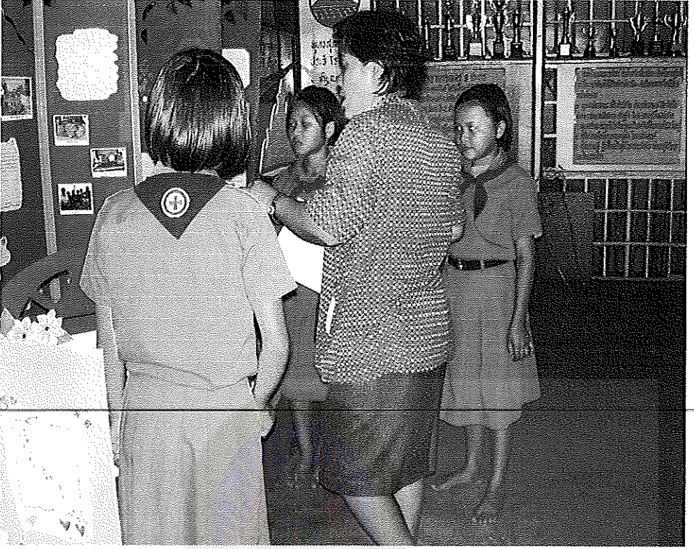
ภาพประกอบการประเมินผลการจัดกิจกรรมการเรียนรู้แบบ โครงงาน