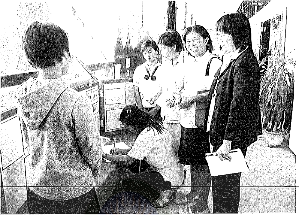
ภาพประกอบการศึกษาดูงาน