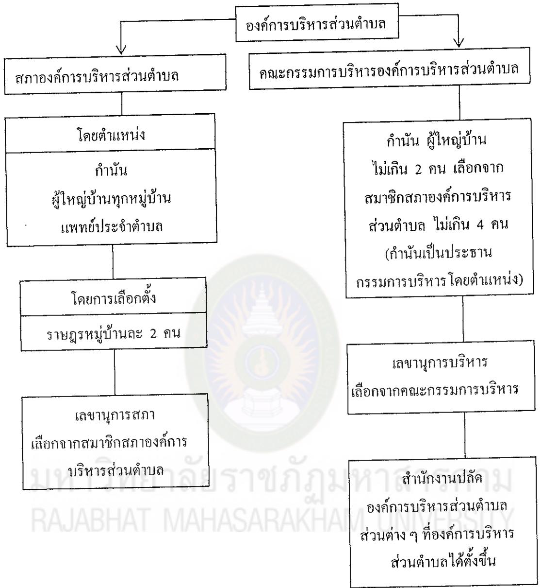
แผนภูมิที่ 1 โครงสร้างองค์การบริหารส่วนตำบล (โครงสร้างเดิม) ตาม พระราชบัญญัติสภาตำบลและองค์การบริหารส่วนตำบล พ.ศ.2537(แก้ไขเพิ่มเติม ฉบับที่ 3 พ.ศ. 2542)