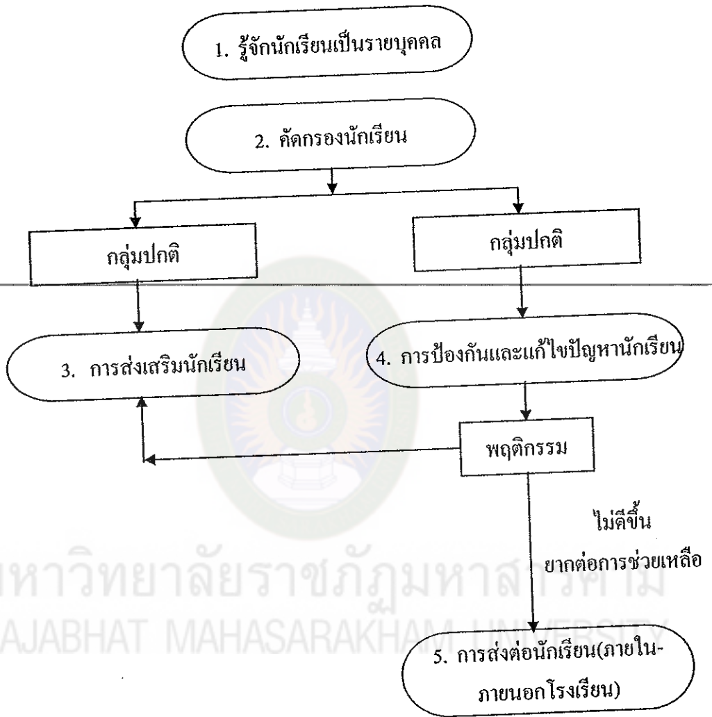
แผนภูมิที่ 1 กระบวนการช่วยเหลือนักเรียนของครูที่ปรึกษาประจำชั้นเรียน