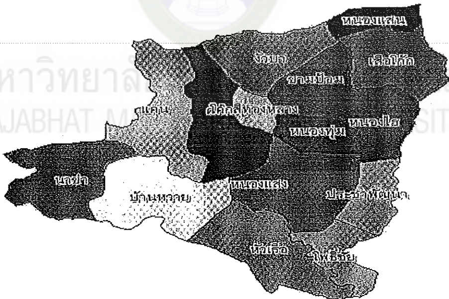
ภาพที่ 1 : แผนที่อำเภอวาปีปทุม จังหวัดมหาสารคาม

ทิศตะวันตก ติดต่อกับตำบลดงใหญ่ อำเภอวาปีปทุม จังหวัดมหาสารคาม