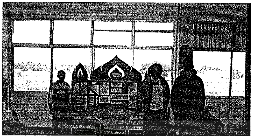
ภาพประกอบ 3 กิจกรรมการเรียนรู้แบบโครงงานของนักเรียนโรงเรียนเทศบาลศรีสวัสดิ์วิทยา