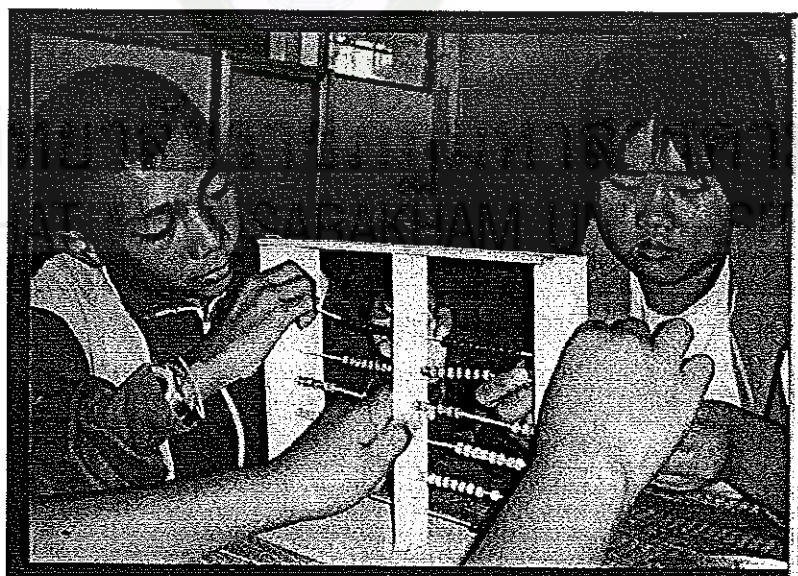
ภาพประกอบ 4 กิจกรรมการเรียนรู้แบบโครงงานของนักเรียนโรงเรียนเทศบาลศรีสวัสดิ์วิทยา