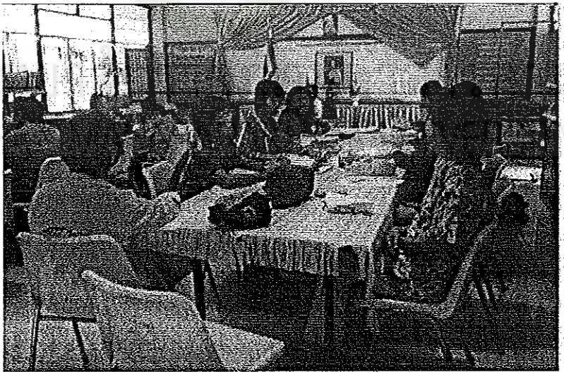
ภาพประกอบ 2 การวางแผนการนิเทศแบบมีส่วนร่วมและการเขียนแผนการจัดการเรียนรู้แบบ โครงการ