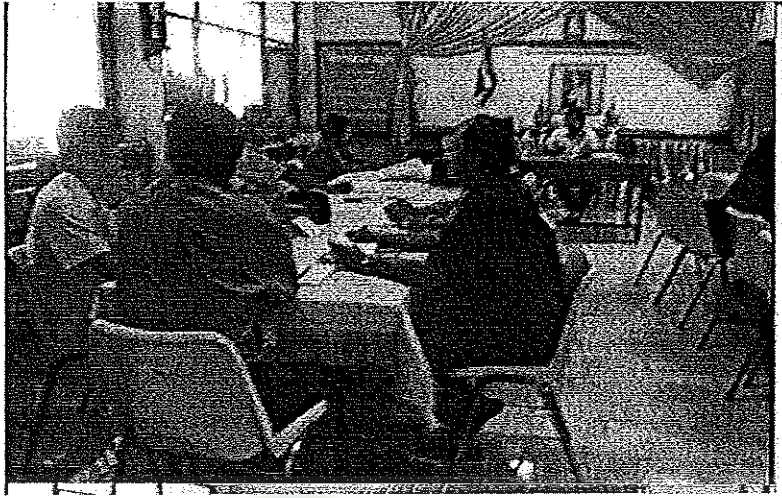
ภาพประกอบ 1 การประชุมเชิงปฏิบัติการคณะครู โรงเรียนเทศบาลศรีสวัสดิ์ดำเนิน