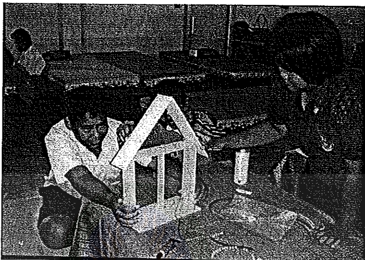
ภาพประกอบ 5 กิจกรรมการเรียนรู้แบบโครงงานของนักเรียนโรงเรียนเทศบาลศรีสวัสดิ์วิทยา

มหาวิทยาลัยราชภัฏมหาสารคาม RAJABHARAT UNIVERSITY