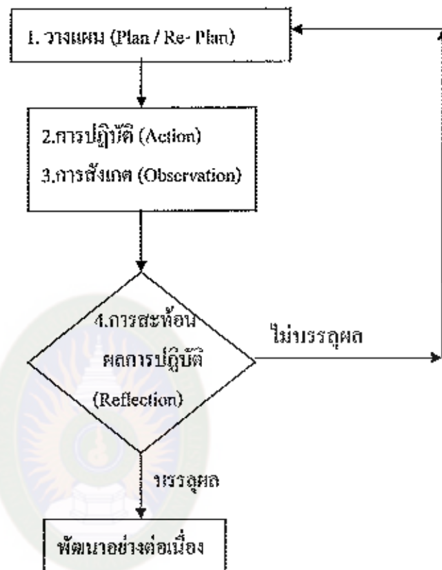
แผนภาพที่ 2 วงจรการวิจัยปฏิบัติการ (Hoonehu's Action Research Spiral)