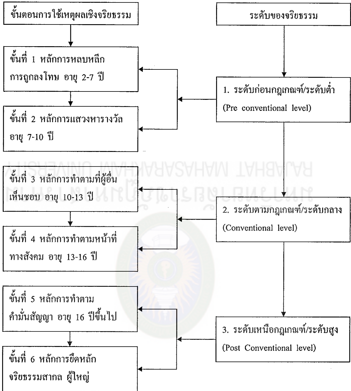
แผนภูมิที่ 2 พัฒนาการเชิงจริยธรรมของโคลเบอร์ก