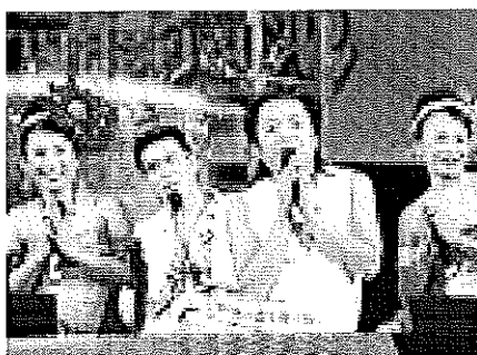
ภาพประกอบที่ 32 แสดงผลงานชุดแรก โปงลางสะออน โลโก้ อิน บางกอก

รูปแบบการแสดงของวง โปงลางสะออนจัดรูปแบบการแสดงแบบการแสดง คอนเสิร์ตของศิลปินนักร้องลูกทุ่งทั่วไป มีการแสดงรำพื้นบ้านผสมผสานการแสดงมุขตลก การร้อง เพลงประกอบการเดิน และการบรรเลงดนตรี โดยรูปแบบการแสดงนั้นสมาชิกในวงโปงลางสะออน มีหน้าที่คิดรูปแบบเอง ซึ่งทางบริษัทอาร์สยามกับทีมงานเป็นฝ่ายจัดเตรียมเวที แสง สี เสียงและ อุปกรณ์