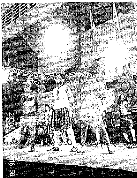
ภาพประกอบที่ 28 แสดงที่สนามศุภชลาศัย