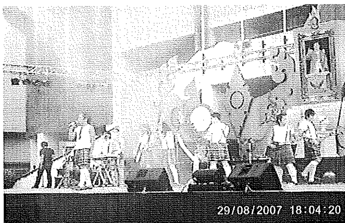
ภาพประกอบที่ 30 แสดงเปิดวง