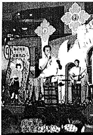
ภาพประกอบที่ 36 การแต่งกายแบบเดิม