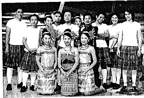
ภาพประกอบที่ 31 บ้านทีกเทพรายการตีสิบ

วงโดยใช้ความรู้ความสามารถที่ได้ศึกษามา ประดิษฐ์ชุดการแสดงพื้นบ้านประยุกต์ที่มีทำรา สนุกสนาน รวดเร็ว ประกอบจังหวะเร้าใจ รวมไปถึงการประดิษฐ์ทำदनประกอบเพลงเพื่อให้เกิด ความเหมาะสมกับรูปแบบของการแสดง การแปรแถวอีกด้วย