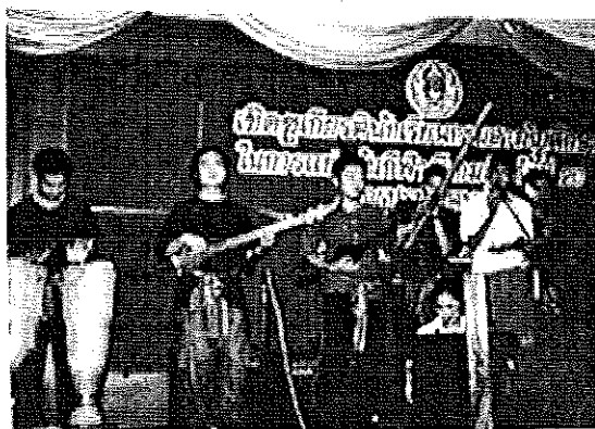
ภาพประกอบที่ 6 ไปแสดงกับทางวิทยาลัยนาฏศิลปกาฬสินธุ์

( Acoustic ) มีเบส พิน แคน กลอง และมีการเพิ่มสมาชิกรวมเป็น 8 คน ต่อมาจึงได้ตั้งวงเป็น "โปงลางสะออน" ก็แสดงตามร้านอาหารใหญ่ๆ ที่ร้าน ไก่อ่างโคราช ถ.วิภาวดีรังสิต ด้วยความสนุกทำให้แขกที่มาที่ร้านติดใจ จึงพัฒนามาเรื่อยๆ เริ่มมีมีมุขเข้ามา แสดงได้ 2 ปี มีร้านอื่นๆ ติดต่อเข้ามาก็มาเล่นที่ร้านไม้เก่า ตลาดอ.ต.ก., ร้านไหคำ แถวปากเกร็ด จนถึงทุกวันนี้ก็เล่นประจำอยู่ที่โรงเบียร์เยอรมันคันทรี่เพลส รังสิต