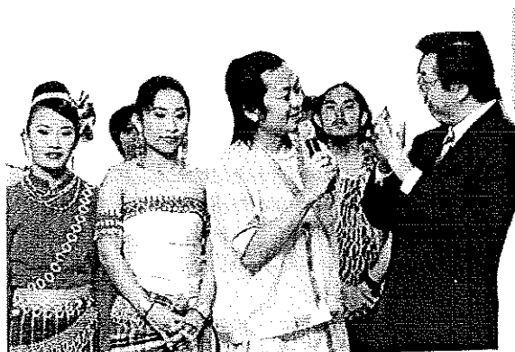
ภาพประกอบที่ 7 ไปแสดงในช่วงคันดารา

หลังจากรายการตีสิบได้แพร่ภาพออกอากาศทางไทยทีวีสีช่อง 3 ก็มีการตอบรับเข้ามาทำให้มีคนรู้จักมากขึ้น มีงานติดต่อให้ไปแสดงมากขึ้น จึงต้องจัดเวลารับงานพอสมควร ในที่สุดทางบริษัทอาร์สยามได้จัดแสดงคอนเสิร์ตใหญ่ครั้งแรกให้วงไปกลางสะออนโดยจัดขึ้นที่ กรุงเทพมหานคร มีชื่อว่า ไปกลางสะออน ไลฟ์ อิน บางกอก บัตรเข้าชมขายหมดตั้งแต่สัปดาห์แรกที่เปิดจำหน่าย แม้ว่าจะเพิ่มการแสดงเป็น 2 รอบแล้วก็ตาม ก็ยังไม่เพียงพอกับความต้องการของผู้ชม แต่ผู้ที่พลาดชมก็สามารถหาซื้อวีซีดีชมได้ ซึ่งเป็นวีซีดีบันทึกการแสดงสดเช่นกัน