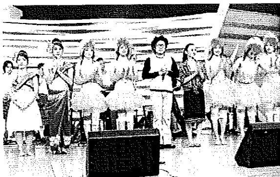
ภาพประกอบที่ 27 รายการตีสิบ

พื้นบ้านอีสาน เช่น ลายลมพัดพร้าว ภูไท ลำเพลิน เป็นต้น มีนักดนตรีเพียง 3 - 4 คน แสดงในร้านอาหารขนาดเล็กเนื่องจากรู้จักกับเจ้าของร้าน ใช้เวลาในการแสดงประมาณ 1 ชั่วโมง ต่อมาจึงมีการปรับเปลี่ยนวิธีการแสดงและพัฒนาให้ทันสมัยมากขึ้นตามลำดับ