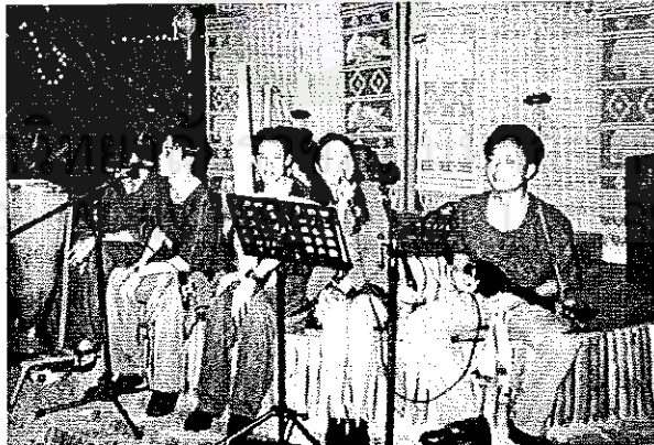
ภาพประกอบที่ 5 แสดงที่ร้านไหคำในช่วงแรก

วงโปงลางสะออนเป็นวงดนตรีอีกรูปแบบหนึ่งที่ผสมผสานระหว่างดนตรีพื้นบ้านอีสาน นาฏศิลป์ และการแสดงสด ในรูปแบบของละครเวที ได้อย่างสนุกสนาน ที่เป็นดนตรีพื้นบ้านอีสานก็ เพราะเกิดจากกลุ่มผู้เรียนนาฏศิลป์ที่เป็นคนอีสาน ที่มีใจรักในดนตรีพื้นบ้านของตนเอง และต้องการ ถ่ายทอดเจตนารมณ์ของคนตรีพื้นบ้านเอาไว้ให้คงอยู่ตลอดไป แต่ถ้าจะเป็นดนตรีพื้นบ้านเสียทั้งหมด คนรุ่นใหม่ก็คงไม่ให้ความสนใจ ดังนั้นจึงมีความคิดแปลกใหม่เกี่ยวกับการนำดนตรีพื้นบ้านมา ประยุกต์ใหม่ให้เข้ากับยุคสมัย ดูแล้วไม่เบื้อ และยังสอดแทรกมุขตลกให้สนุกสนาน จนทำให้โปงลาง สะออนที่มีความคิดแต่เพียงจะสืบทอดวัฒนธรรมดนตรีพื้นบ้านเท่านั้น ตอนนี้มีชื่อเสียงเป็นที่รู้จัก