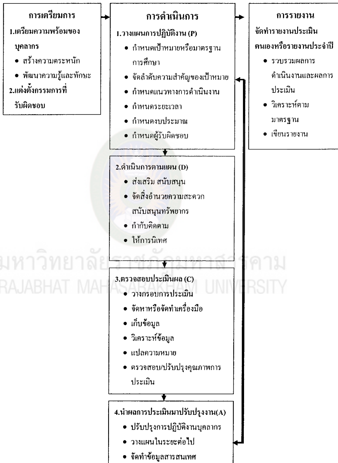
แผนภูมิที่ 2 ขั้นตอนการดำเนินการประกันคุณภาพภายใน

ประเมินคุณภาพการศึกษา (2544 : 13) ได้เสนอขั้นตอนในการดำเนินการประกันคุณภาพภายใน ดังแผนภูมิที่ 2