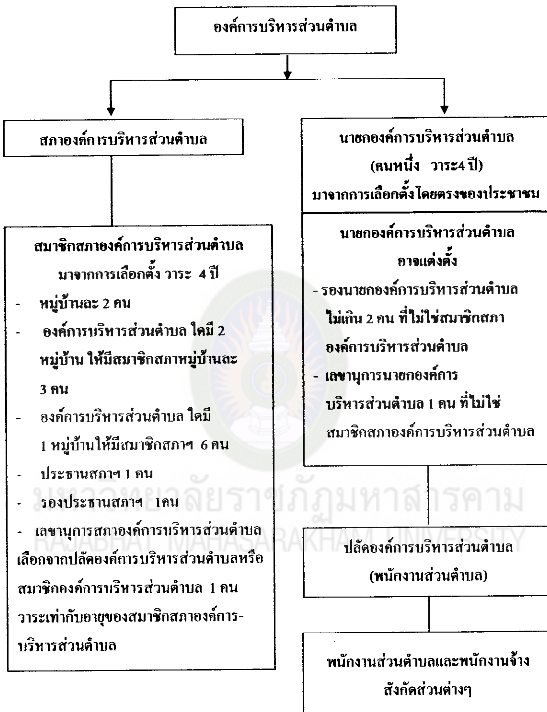
แผนภูมิที่ 1 : โครงสร้างองค์การบริหารส่วนตำบล ตามพระราชบัญญัติสภาตำบลและองค์การบริหารส่วนตำบล พ.ศ. 2537 แก้ไขเพิ่มเติม (ฉบับที่ 5) พ.ศ. 2546