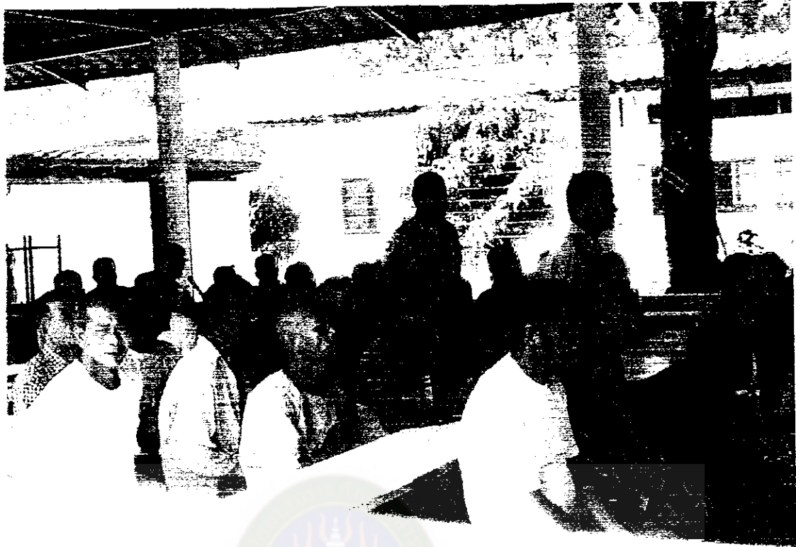
การค้นหาปัญหาในชุมชนและแนวคิดของแต่ละคนในกลุ่มแกนนำ