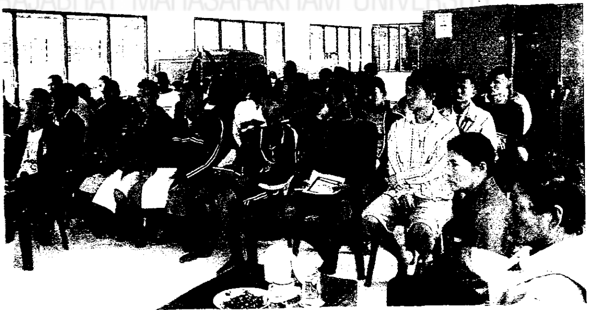
ผู้เข้าร่วมประชุมเชิงปฏิบัติการ

มหาวิทยาลัยราชภัฏมหาสารคาม RAJABHAT MAHASARAKHAM UNIVERSITY