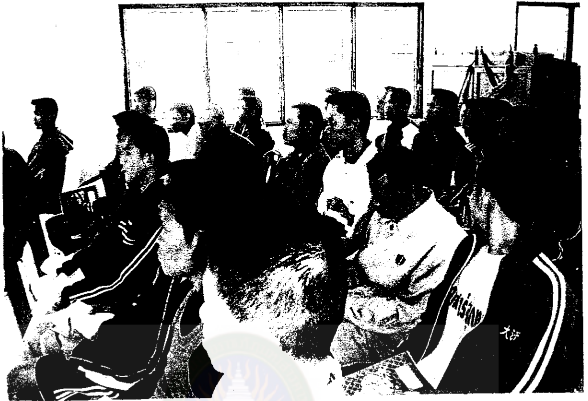
ผู้เข้าร่วมประชุมเชิงปฏิบัติการ

มหาวิทยาลัยราชภัฏมหาสารคาม RAJABHAT MAHASARAKHAM UNIVERSITY