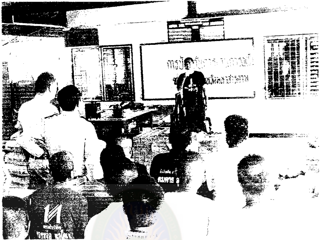
ผู้เข้าร่วมการประชุมแสดงข้อคิดเห็นและร่วมวิเคราะห์ปัญหา