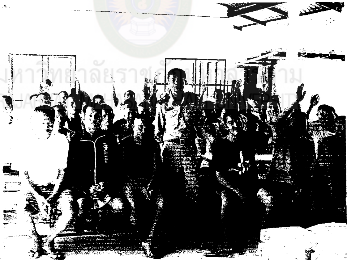
การเลือกแนวทางกิจกรรมและผู้รับผิดชอบ