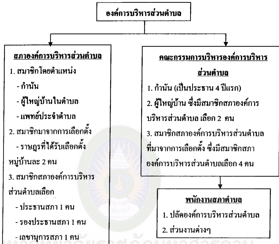
แผนภูมิที่ 1 โครงสร้างองค์การบริหารส่วนตำบล ตามพระราชบัญญัติสภาตำบล และองค์การบริหารส่วนตำบล พ.ศ.2537

คณะกรรมการบริหารองค์การบริหารส่วนตำบล (โครงสร้างเดิมถูกแก้ไขให้ยกเลิกไปแล้ว) คณะกรรมการบริหารองค์การบริหารส่วนตำบล ประกอบด้วย กำนัน (เป็นประธาน 4 ปีแรก) ผู้ใหญ่บ้าน ไม่เกิน 2 คน และสมาชิกที่ได้รับเลือกตั้ง ไม่เกิน 4 คน ซึ่งนายอำเภอเป็นผู้แต่งตั้ง ตามมติของสภาองค์การบริหารส่วนตำบล อยู่ในตำแหน่งคราวละ 4 ปี ให้คณะกรรมการบริหาร เลือกกรรมการบริหารคนหนึ่ง เป็นประธานกรรมการบริหาร และเลือกกรรมการบริหารอีกคนหนึ่งเป็นเลขานุการคณะกรรมการบริหาร บทเฉพาะกาล ได้กำหนดไว้ใน 4 ปีแรก นับตั้งแต่วันที่พระราชบัญญัติสภาตำบลและองค์การบริหารส่วนตำบลใช้บังคับ ให้กำนันเป็นประธานกรรมการบริหาร โดยตำแหน่ง การกำหนดให้องค์การบริหารส่วนตำบลมีทั้งสภาองค์การบริหารส่วนตำบล และคณะกรรมการบริหารองค์การบริหาร