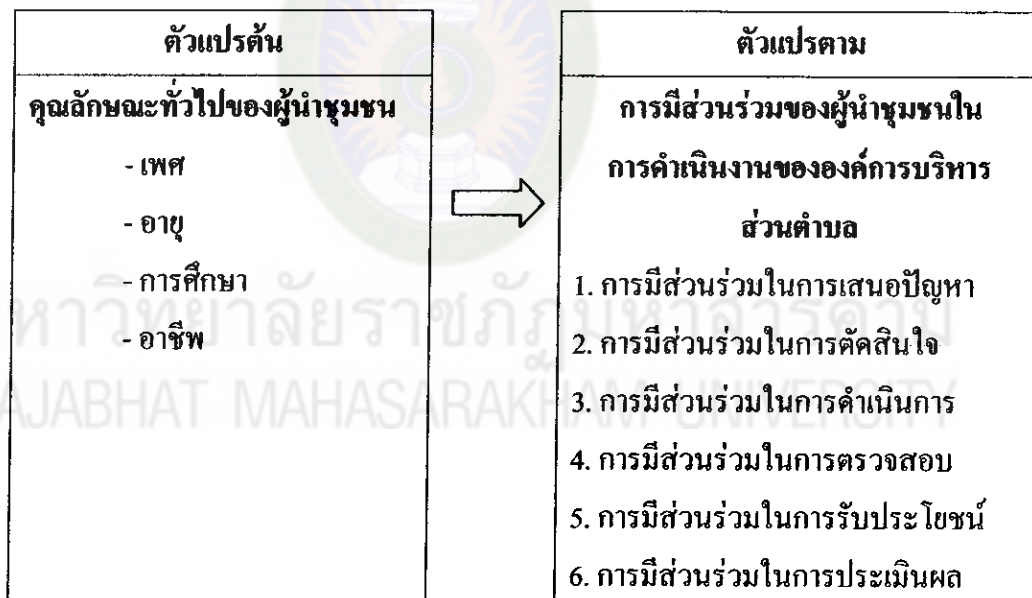
แผนภูมิที่ 3 กรอบแนวคิดในการวิจัย

ซึ่งสรุปเป็นกรอบแนวคิดในการวิจัย ดังแผนภูมิที่ 3