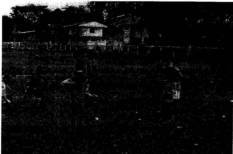
ภาพที่ 6 กิจกรรมยามว่างของเด็กเร่ร่อน

5.4 การนอนพักผ่อน คือ เด็กเร่ร่อนกลุ่มนี้จะมีการหารายได้ในตอนกลางคืน ในช่วงเวลากลางวันจึงเป็นการนอนพักผ่อน คือ หลังจากการกินข้าวแล้ว ถ้าไม่ออกไปหารายได้ก็จะนอนพักเพื่อช่วงกลางคืนจะออกไปหารายได้ ซึ่งมักจะนอนแถว ๆ สวนรัชดา หน้าร้านชาญท้าว เป็นคั่น