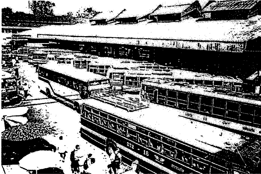
ภาพที่ 2 สถานที่หารายได้ของเด็กเร่ร่อน (บขส.)

บางครั้งอาหารที่ได้มาอาจจะได้มาจากการขออาหารตามร้านอาหารโดยที่ไม่ได้ทำงานตอบแทน และอาหารที่ได้มาอีกส่วนหนึ่งจะได้มาจากการซื้อหาเอง