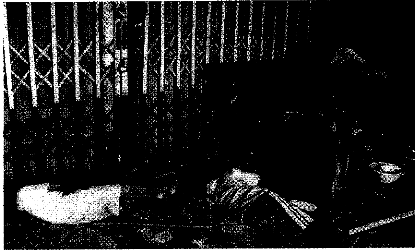
ภาพที่ 1 สถานที่หลับนอนของเด็กเร่ร่อน