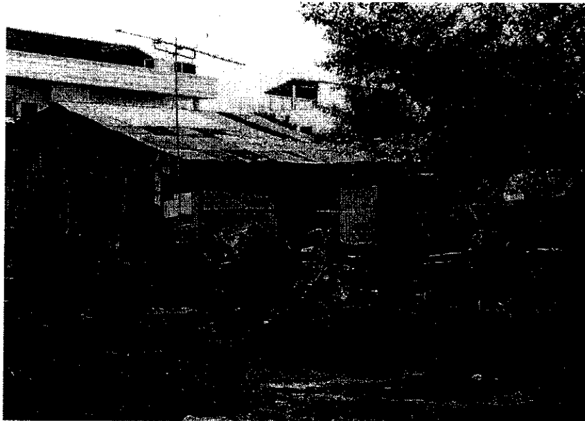
ภาพที่ 8 ลักษณะที่อยู่อาศัยหลบนอน

เด็กเร่ร่อนเหล่านี้จะอาศัยอยู่ไม่เป็นหลักแหล่ง ขึ้นอยู่กับตัวของเด็กเอง และการหาเงินแต่สถานที่ที่เด็กเหล่านี้ชอบอยู่อาศัยหลบนอน คือ ตามสถานที่ต่าง ๆ เช่น สวนรัชดา สถานีรถไฟ บ.ข.ส. บึงแก่นนคร หน้าร้านทอง (ที่ บ.ข.ส.) บนสะพานลอย บ้านร้างในโรงหนังราม่า ตลาดโป้แป๊ะ สนามโกคาท (สนามกอล์ฟ) วัดศรีนวล วัดบ้านศรีสุคนธ์ บารั๊วร้าง เป็นต้น และจะมีเด็กบางคนที่ออกจากชุมชนต่าง ๆ ในเขตเทศบาลนครขอนแก่น ออกมาเร่ร่อน คือ เด็กเหล่านี้จะเป็นเด็กเร่ร่อนชั่วคราว จะออกมาเร่ร่อนบางช่วง บางช่วงก็จะกลับเข้าบ้านที่อยู่ในชุมชน คือ ชุมชนเทพารักษ์ 5 ชุมชนเทพารักษ์ 1 ชุมชนสามเหลี่ยม ชุมชนบ้านดุม เป็นต้น