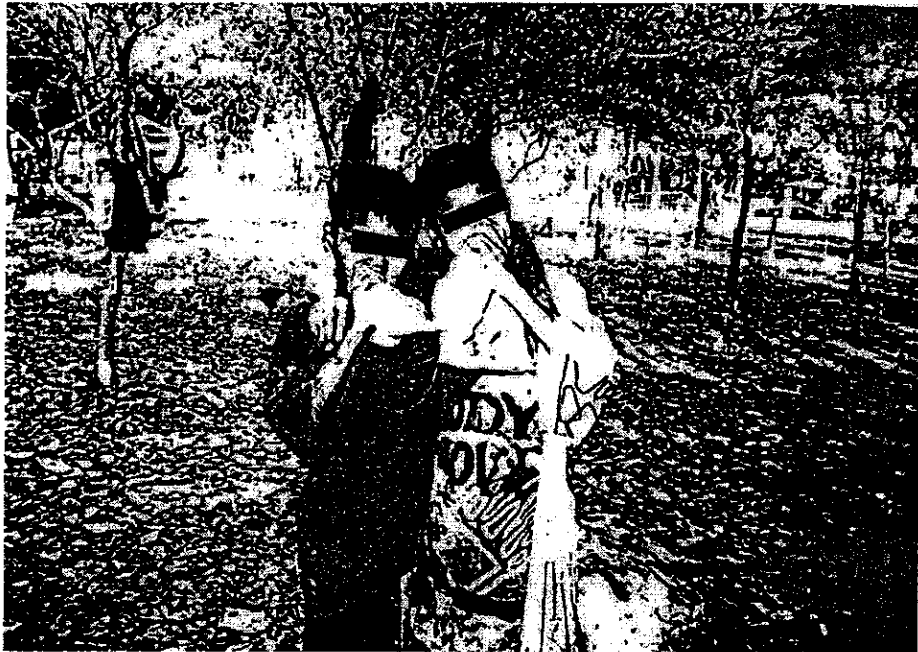
ภาพที่ 5 การใช้จ่าย (เชื้อสารเสพติด)

ก็จะหาอาหารเองตามศาลพระภูมิ และศาลเจ้าต่างๆ ในเขตเทศบาลนครขอนแก่น ที่ผู้คนนำมา บวงสรวง แก้วบน เป็นต้น และนำมาจากวัดในงานเทศกาลต่าง ๆ แล้วจะมีการรวมกลุ่มกัน กินด้วยกัน