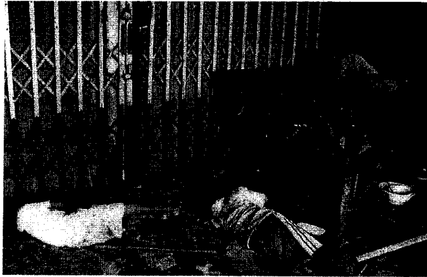
ภาพที่ 9 ลักษณะที่อยู่อาศัยหลับนอนตอนกลางวัน