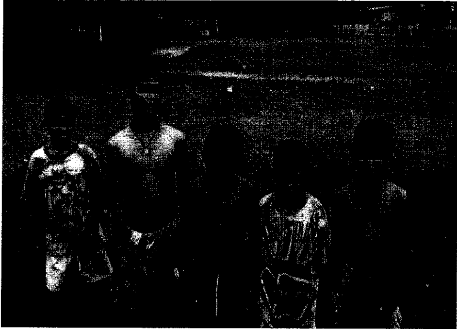
ภาพที่ 10 ลักษณะการแต่งกาย