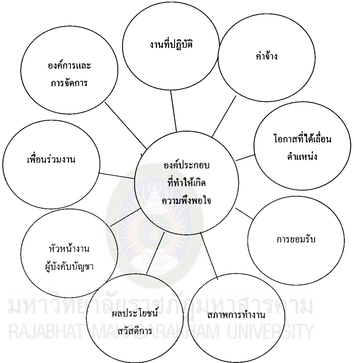
แผนภูมิที่ 1 องค์ประกอบที่ทำให้เกิดความพึงพอใจในงาน