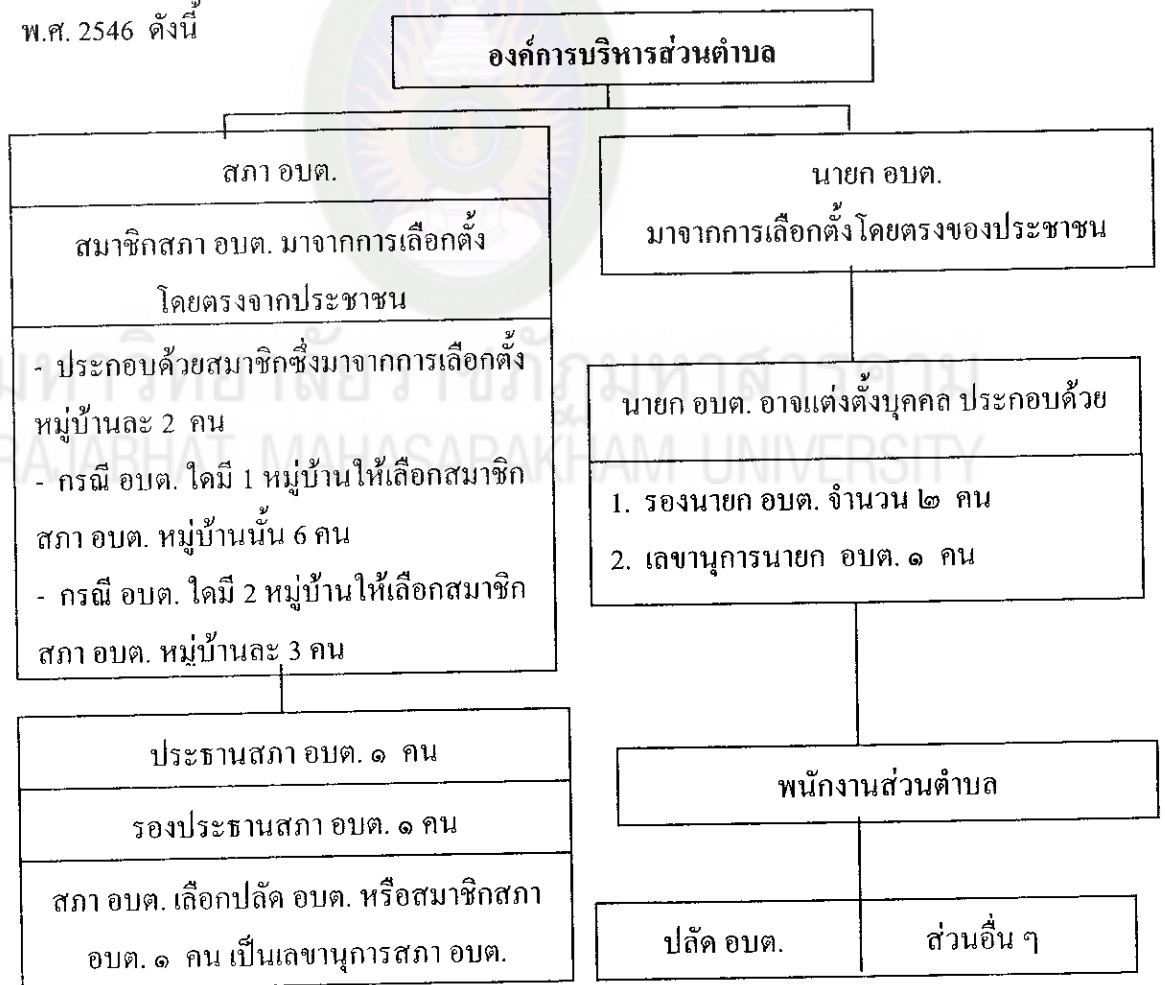
แผนภูมิที่ 1 โครงสร้างองค์การบริหารส่วนตำบล ตามพระราชบัญญัติสภาตำบล และองค์การบริหารส่วนตำบล พ.ศ. 2537 แก้ไขเพิ่มเติมถึงฉบับที่ 5 พ.ศ. 2546

องค์การบริหารส่วนตำบลแบ่งโครงสร้างองค์กรออกเป็น 2 ฝ่าย ตามพระราชบัญญัติสภาตำบลและองค์การบริหารส่วนตำบล พ.ศ. 2537 แก้ไขเพิ่มเติมถึงฉบับที่ 5 พ.ศ. 2546 ดังนี้