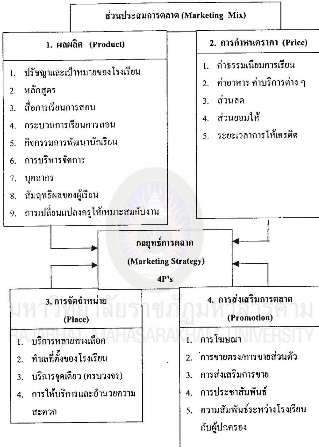
ภาพประกอบที่ 4 ส่วนประสมการตลาด