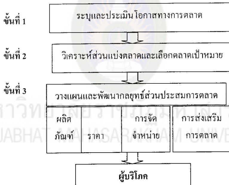
ภาพประกอบที่ 6 ขั้นตอนการวางแผนกลยุทธ์การตลาด

ขั้นที่ 3 การวางแผนและพัฒนากลยุทธ์ส่วนประสมตลาด เป็นการดำเนินงานเพื่อให้สอดคล้องตามความต้องการของตลาดเป้าหมายที่ได้เลือกไว้ และทำให้ลูกค้าเกิดความพอใจในผลิตภัณฑ์และบริการ ดังภาพประกอบที่ 6