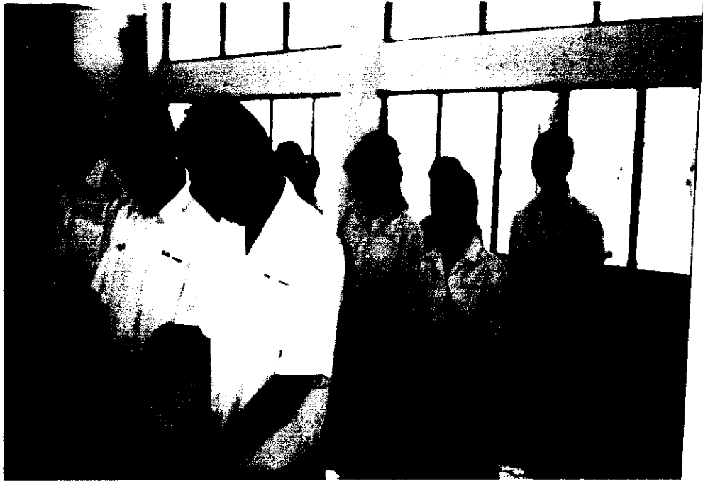
ภาพที่ 7 นักเรียนปฏิบัติการบริหารจัดการตามหลักอานาปานสติ ในอิริยาบถเดิน