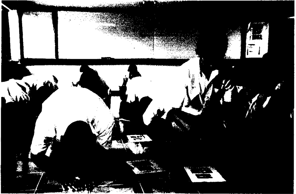
ภาพที่ 2 นักเรียนปฏิบัติตามขั้นตอนของแบบฝึกการบริหารจิตตามหลักอานาปานสติ ที่ผู้วิจัยพัฒนาขึ้น