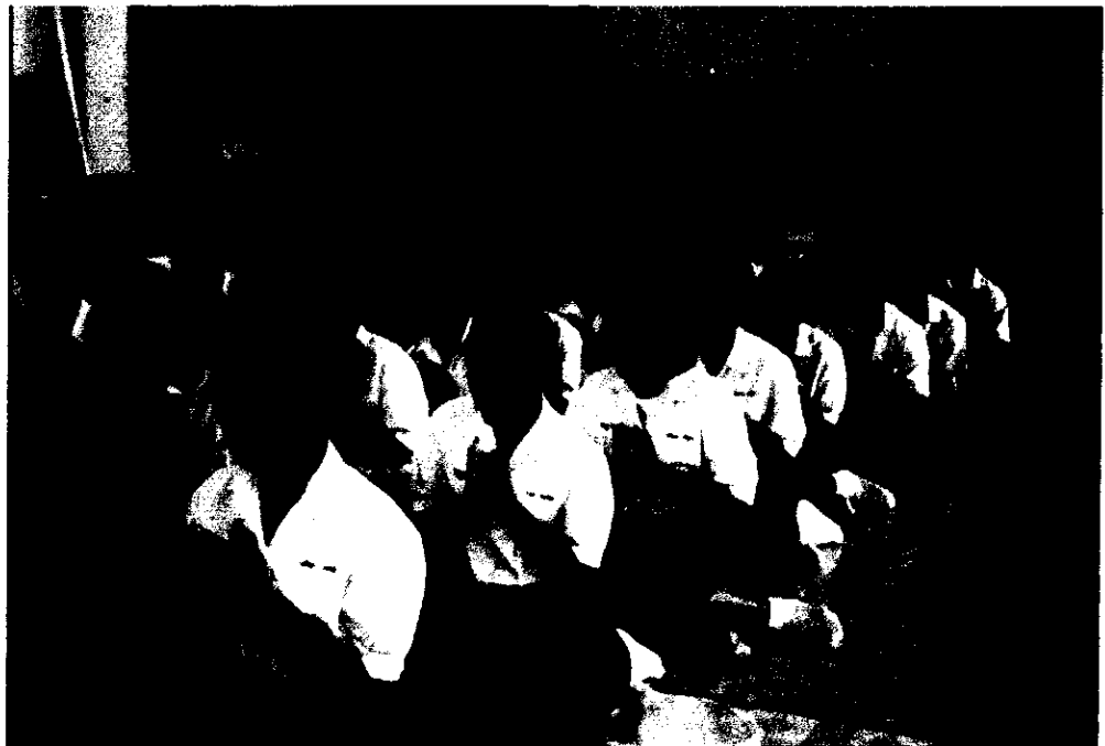
ภาพที่ 4 นักเรียนร่วมกันสวดสรรเสริญคุณพระรัตนตรัย พร้อมเพรียงกัน