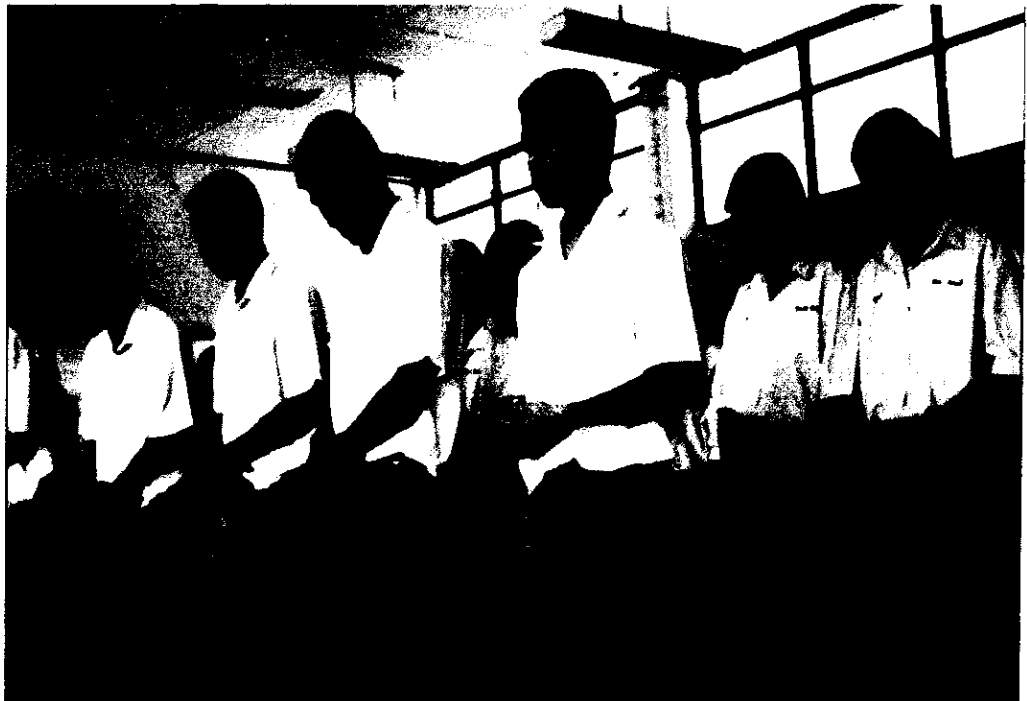
ภาพที่ 6 นักเรียนปฏิบัติการบริหารจิตตามหลักอานาปานสติ ในอริยาบถเดิน