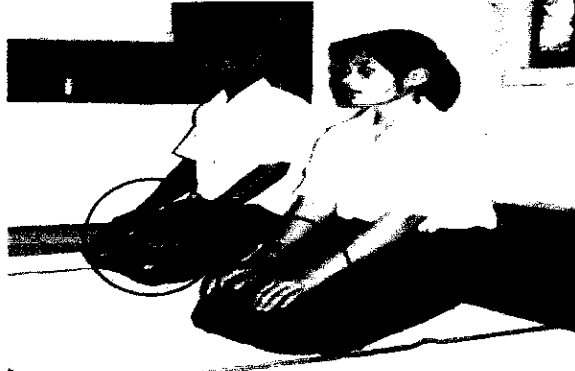
ลำดับที่ 1