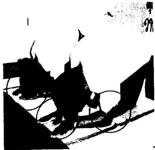
ลำดับที่ 3