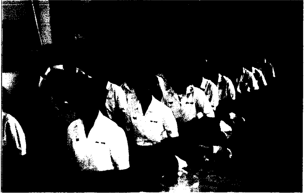
ภาพที่ 5 นักเรียนนั่งปฏิบัติสมาธิในอริยาบถนั่ง