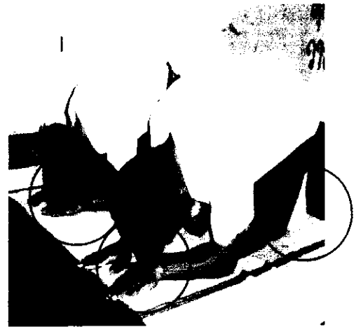
ลำดับที่ 3