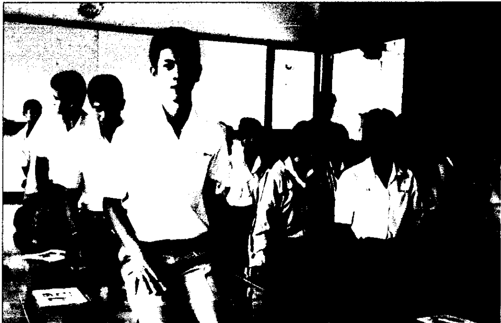
ภาพที่ 1 นักเรียนเตรียมตัวกราบ และเตรียมสวดสรรเสริญคุณพระรัตนตรัยหลัง ได้รับ แบบฝึกการบริหารจิตตามหลักอานาปานสติ