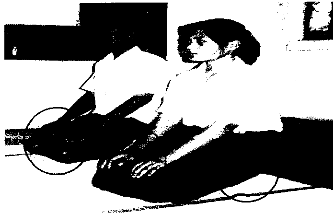
ลำดับที่ 1