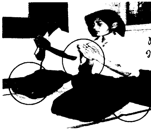
ลำดับที่ 2