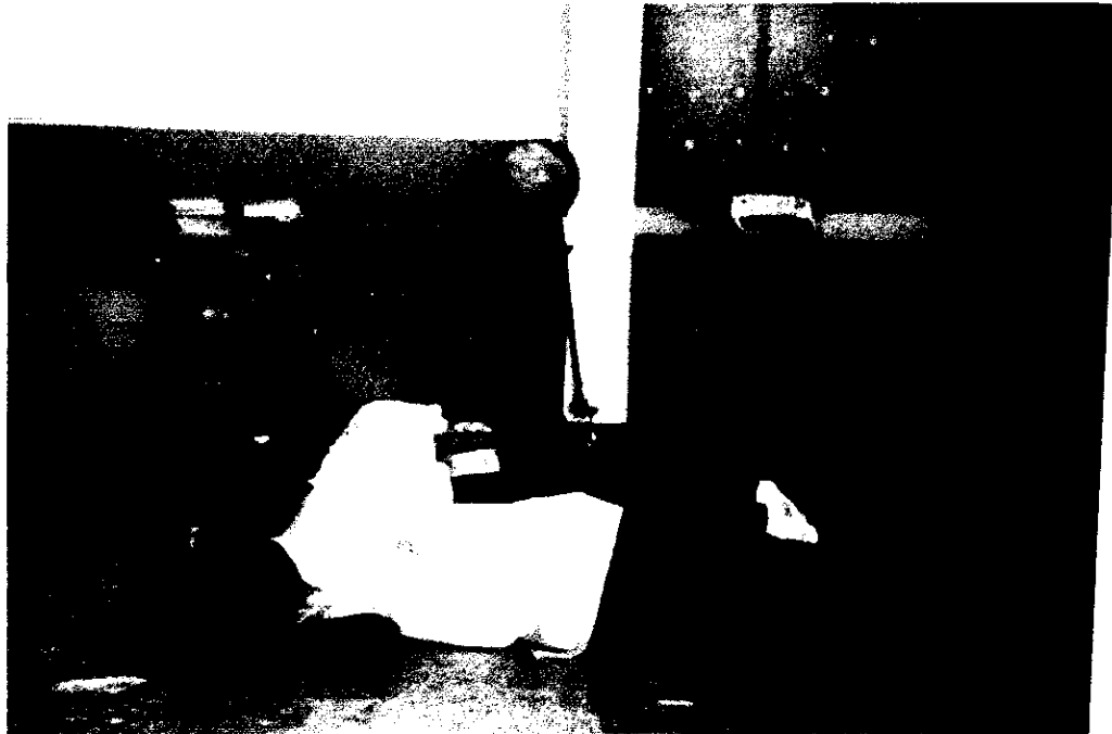
ภาพที่ 8 นักเรียนปฏิบัติการบริหารจัดการตามหลักอานาปานสติ ในอิริยาบถนอน