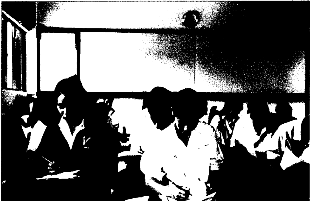
ภาพที่ 10 นักเรียนกำลังทำการทดสอบข้อสอบ หลังการใช้แบบฝึกการบริหารจิตตามหลักอานาปานสติ