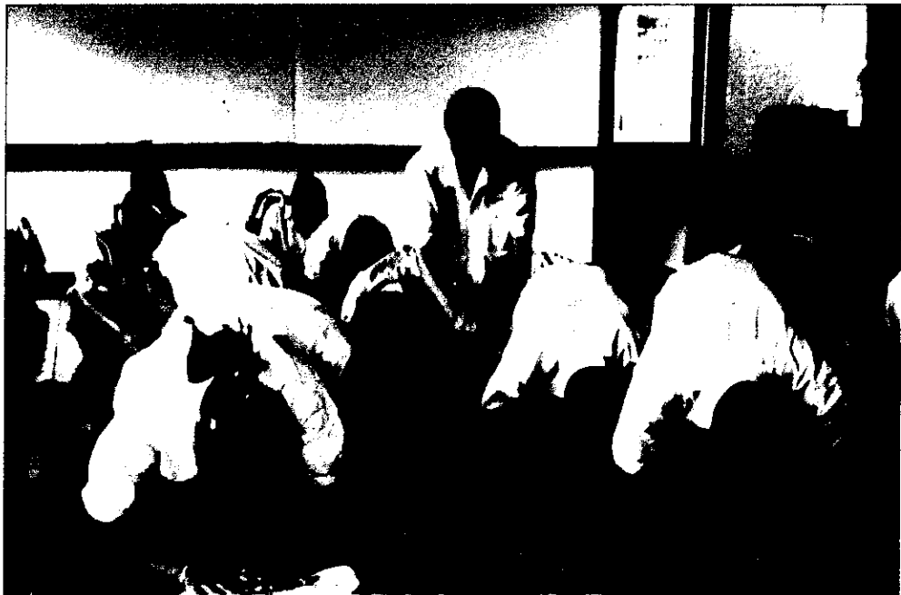
ภาพที่ 2 นักเรียนกราบพระอาจารย์ ก่อนเรียนและฝึกการบริหารจิตตามหลักอานาปานสติ ด้วยแบบฝึกการบริหารจิต