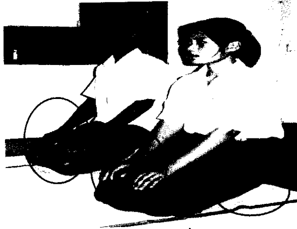
ลำดับที่ 1