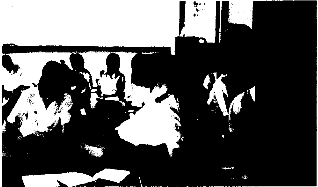
ภาพที่ 9 นักเรียนกำลังทำกิจกรรมทดสอบข้อสอบย่อยท้ายแบบฝึก ที่ผู้วิจัยพัฒนาขึ้น