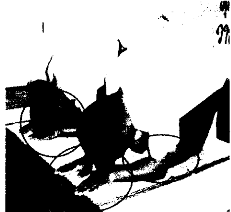
ลำดับที่ 3