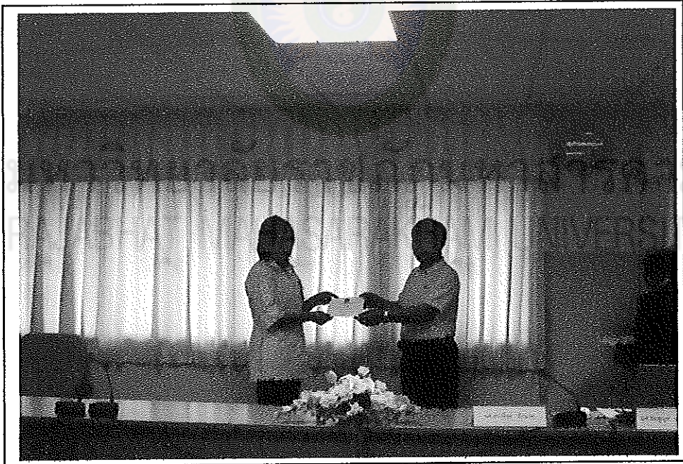
มอบเกียรติบัตรแก่ผู้ร่วมศึกษา