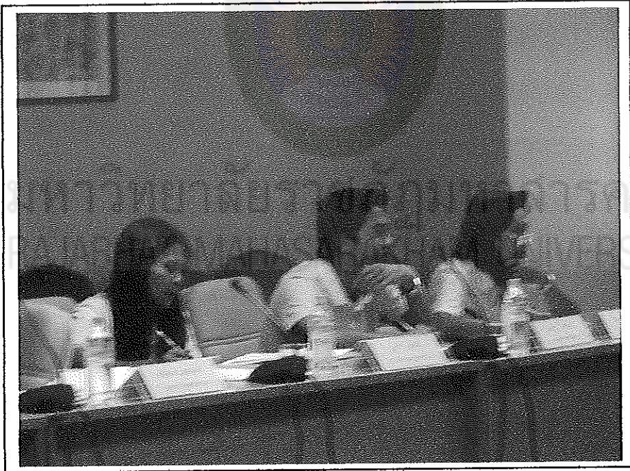
บรรยากาศการประชุมเชิงปฏิบัติการ