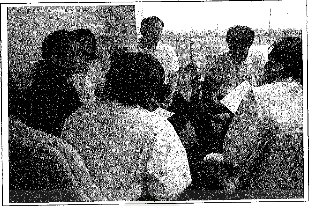
ผู้ร่วมศึกษา ระดมความเห็นกลุ่มย่อย