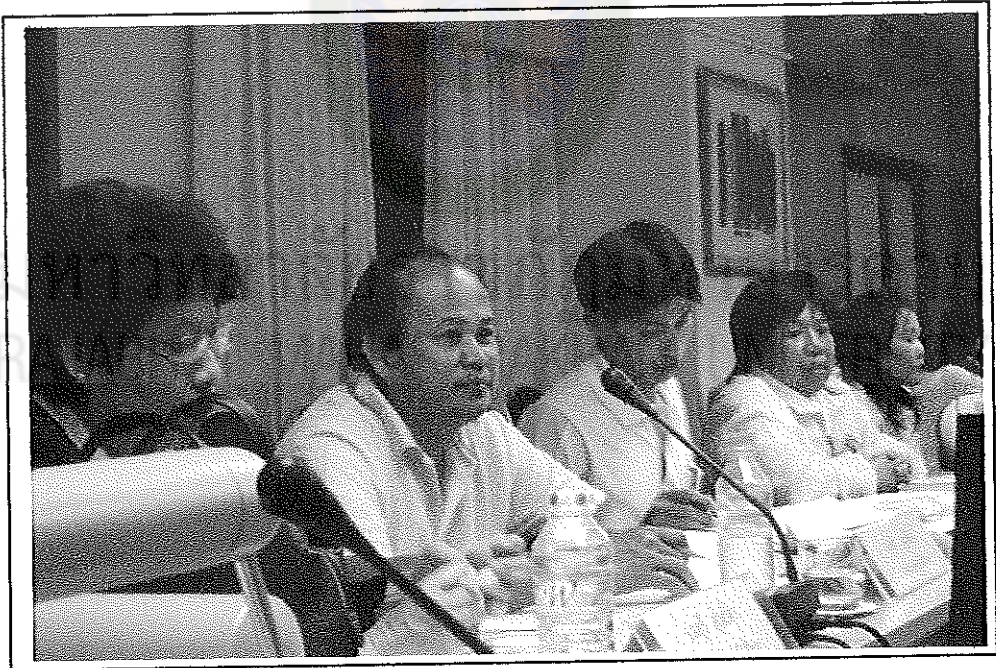
บรรณาธิการประชุมเชิงปฏิบัติการ