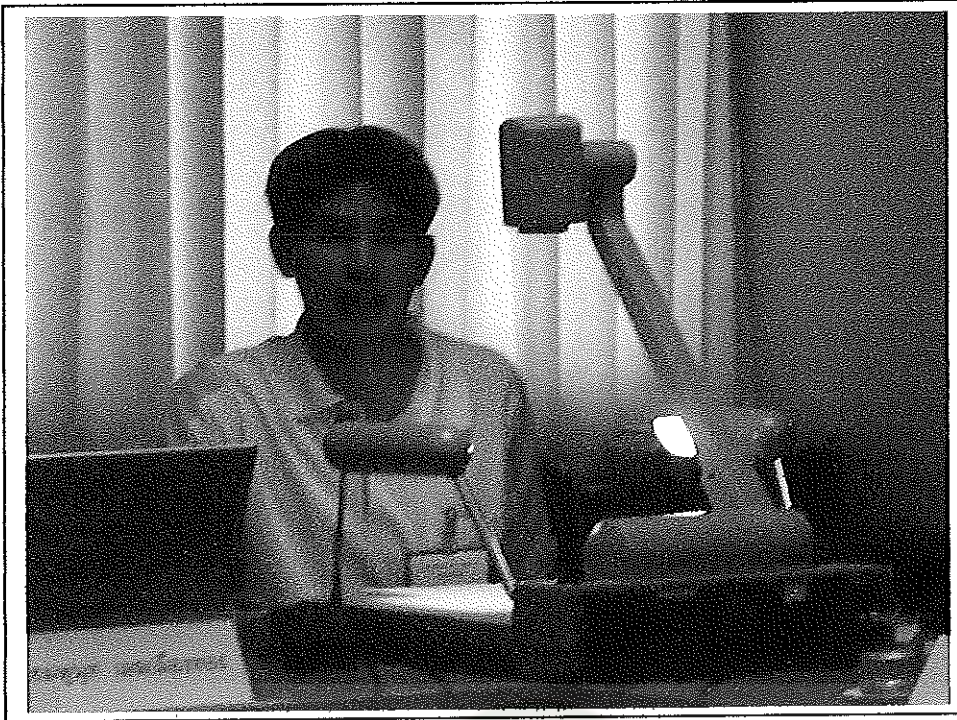
ตัวแทนกลุ่มย่อยกลุ่มที่ 1 นำเสนอผลการสัมมนากลุ่มย่อย