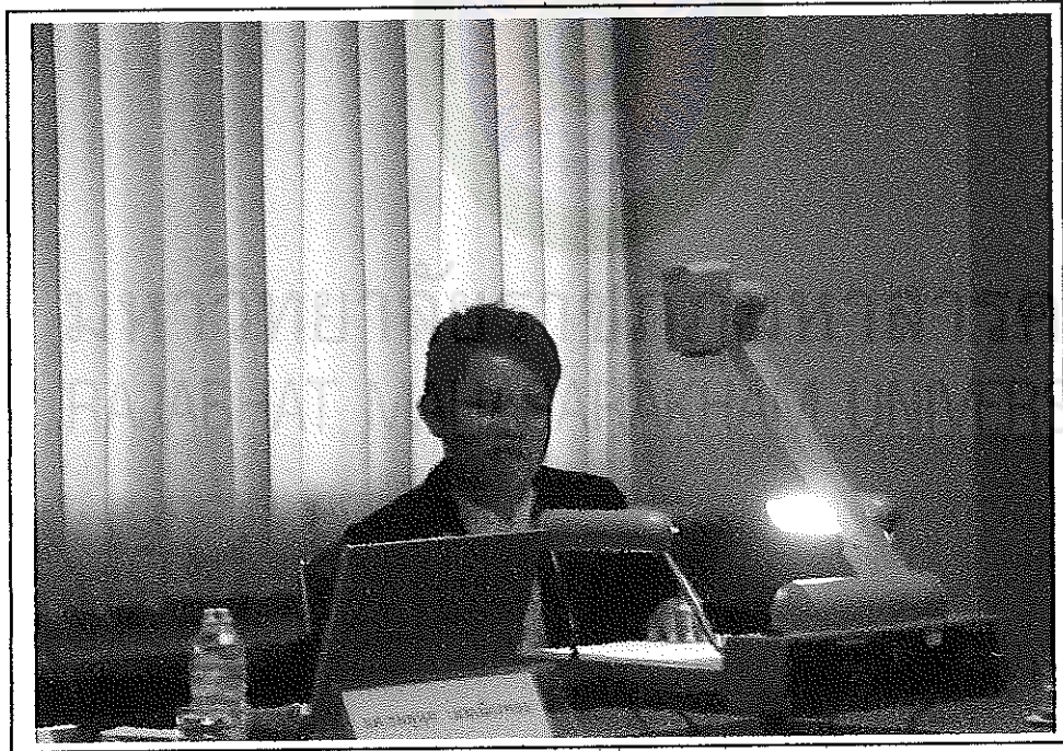
ตัวแทนกลุ่มย่อยกลุ่มที่ 2 นำเสนอผลการสัมมนากลุ่มย่อย