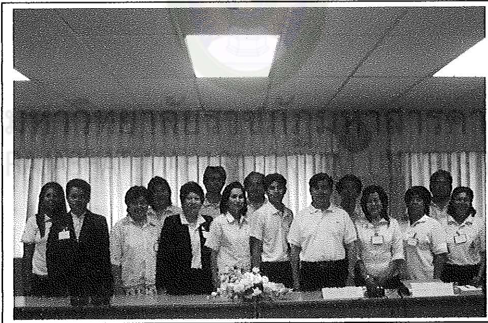
ผู้ร่วมศึกษาและผู้วิจัย