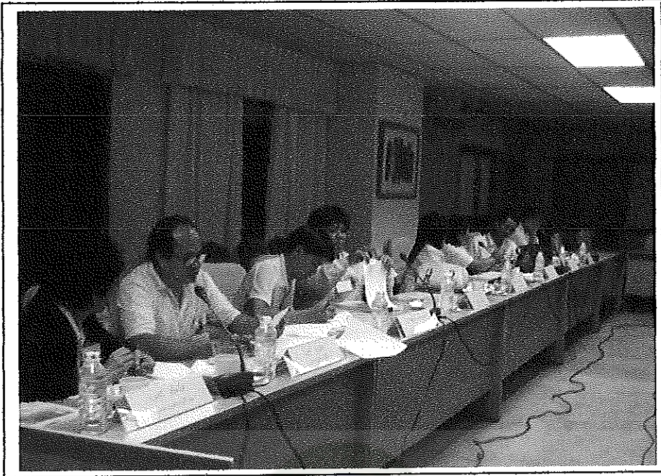
บรรยากาศการประชุมเชิงปฏิบัติการ