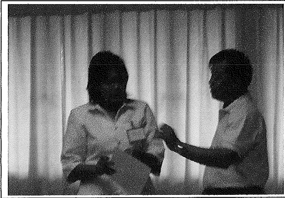
ผู้ร่วมศึกษาสอบถามความรู้เพิ่มเติมหลังการประชุมเชิงปฏิบัติการ