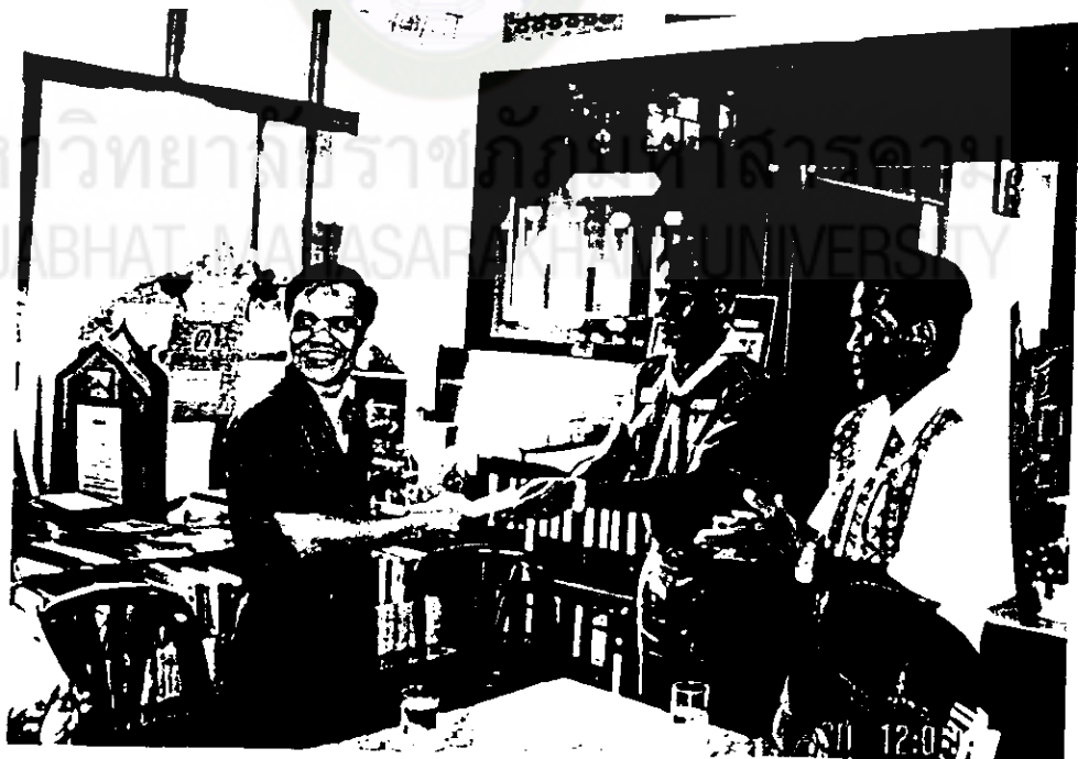
มอบของที่ระลึกให้แก่ผู้อำนวยการสถานศึกษาโรงเรียนบ้านน้ำสร้างหนองบะ