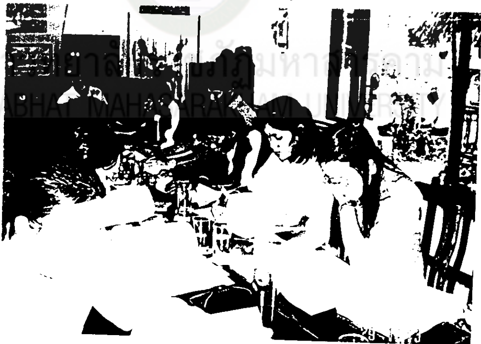
ผู้ร่วมวิจัยวิเคราะห์หลักสูตรสถานศึกษา