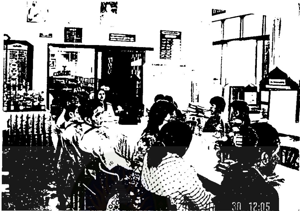
ศึกษาคูงานการจัดทำหลักสูตรสถานศึกษา ณ โรงเรียนบ้านน้ำสร้างหนองบะ