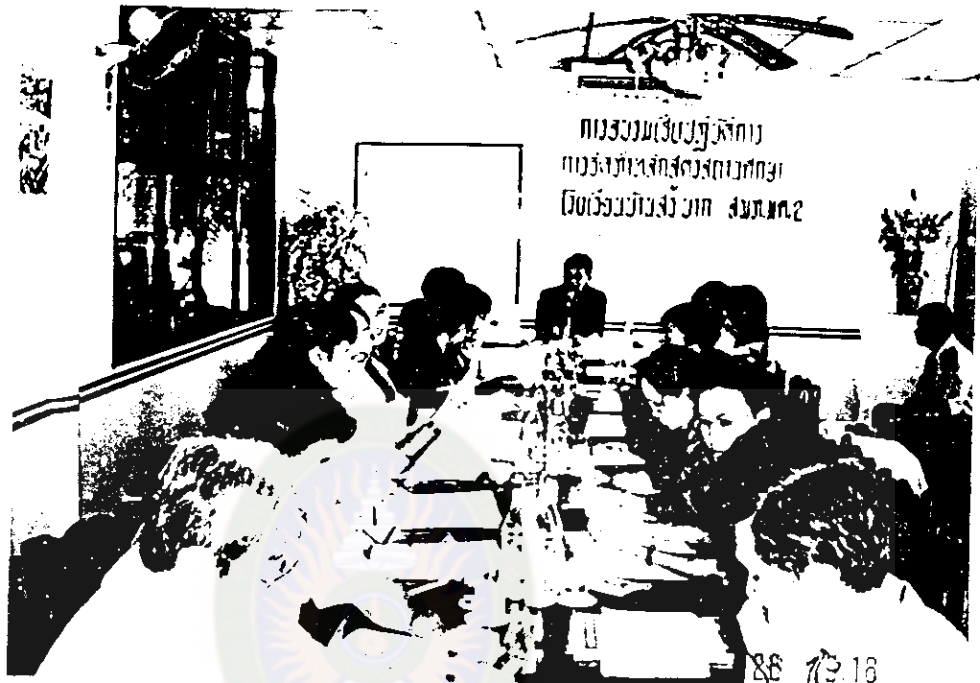
การอบรมปฏิบัติการการจัดทำหลักสูตรสถานศึกษา