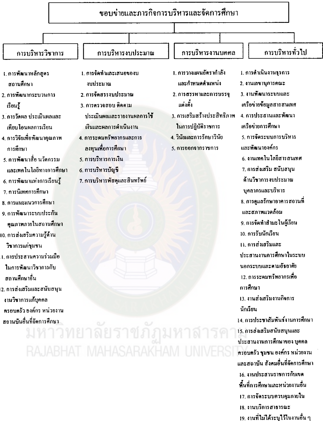
ภาพประกอบที่ 2 ขอบข่ายการบริหารสถานศึกษาทั้ง 4 ด้าน (กระทรวงศึกษาธิการ. 2546 : 32)