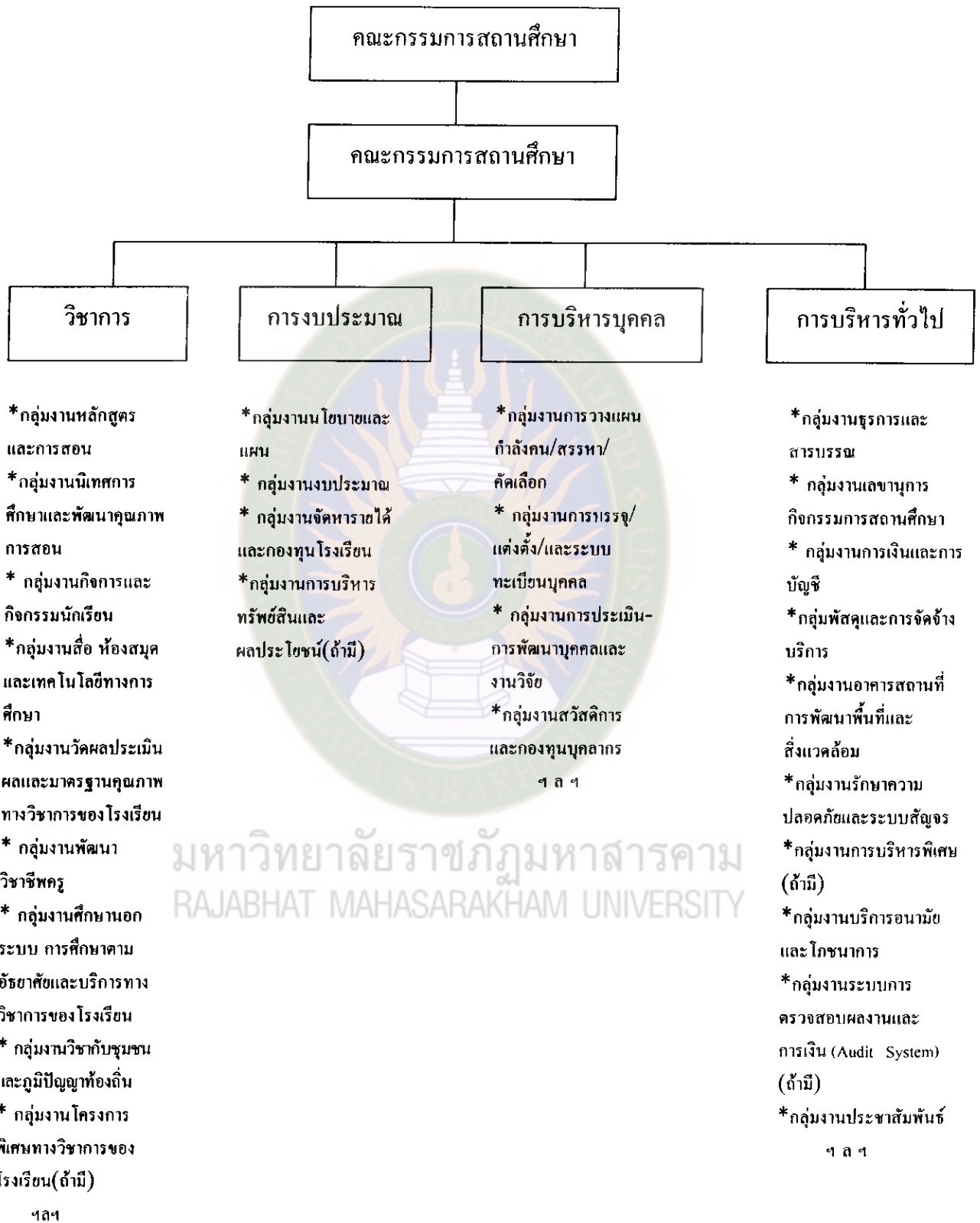
แผนภูมิ 2 แผนผังโครงสร้างองค์กรตามแนวการกระจายอำนาจ