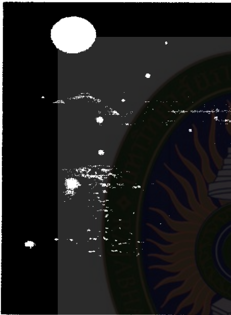
ภาพที่ 2 จำลองการเกิดปรากฏการณ์บั้งไฟพญานาค

ส่วนชาวเวียงจันทน์ สปป.ลาว เรียก "ดอกไม้ไฟน้ำ" ความอัศจรรย์แห่งการเกิด "บั้งไฟพญานาค" สร้างความมหัศจรรย์ให้กับประชาชนทั้ง 2 ฝั่ง ไทย - ลาว ซึ่งมีความเชื่อและศรัทธาเหมือนกัน และยังสร้างความสงสัยให้เกิดขึ้นในสังคมเป็นวงกว้าง เมื่อยิ่งสงสัยก็ยิ่งอยากจะไปดูและพิสูจน์ให้เห็นกับตา (ผู้จัดการออนไลน์. 2548 : ม.ป.ศ.)