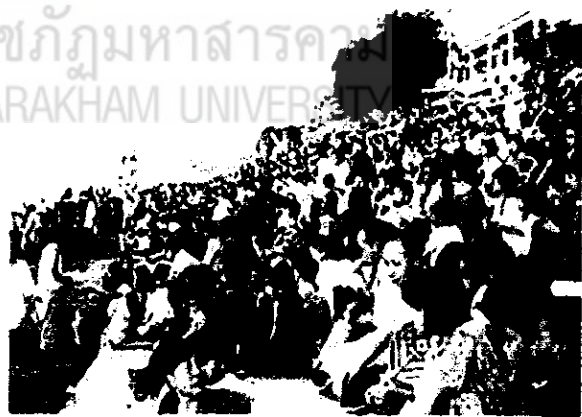
ภาพที่ 1 ผู้คนรอชมปรากฏการณ์บั้งไฟพญานาค บริเวณวัดหลวง อำเภอโพนพิสัย (28 ต.ค.47)

ประชาชนเรือนแสนจากทั่วทุกสารทิศ ทั้งคนไทยและต่างชาติ ต่างมุ่งหน้าสู่จุดหมายเดียวกันนั่นคือการรอชม “บั้งไฟพญานาค” ที่อำเภอโพนพิสัย จังหวัดหนองคายและอีกหลายอำเภอที่มีพื้นที่ติดกับแม่น้ำโขง เพื่อรอชมลูกไฟสีแดงอมชมพูที่พุ่งขึ้นจากแม่น้ำโขง มีขนาดตั้งแต่ หัวแม่มือถึงฟองไข่ไก่ ไม่มีกลิ่น ไม่มีควัน ไม่มีเสียง ไม่มีการ