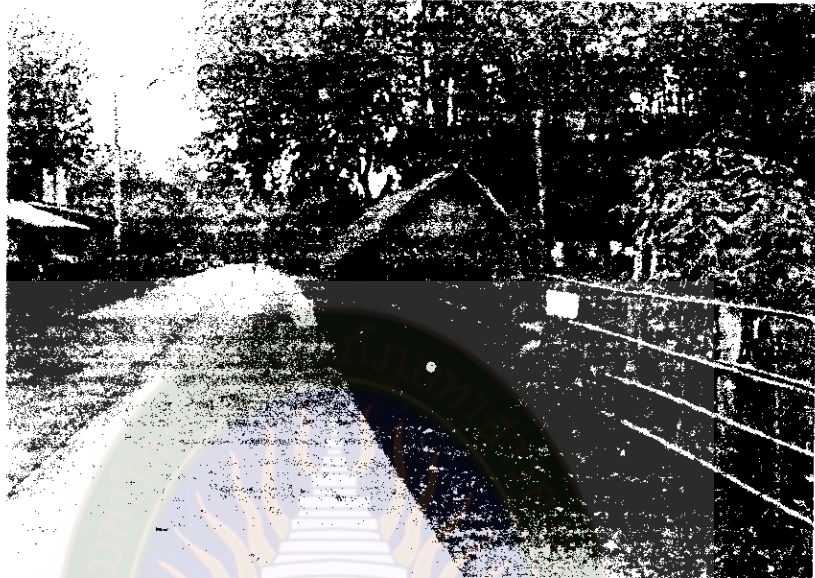
ภาพที่ 23 หมู่บ้านลุมพุก