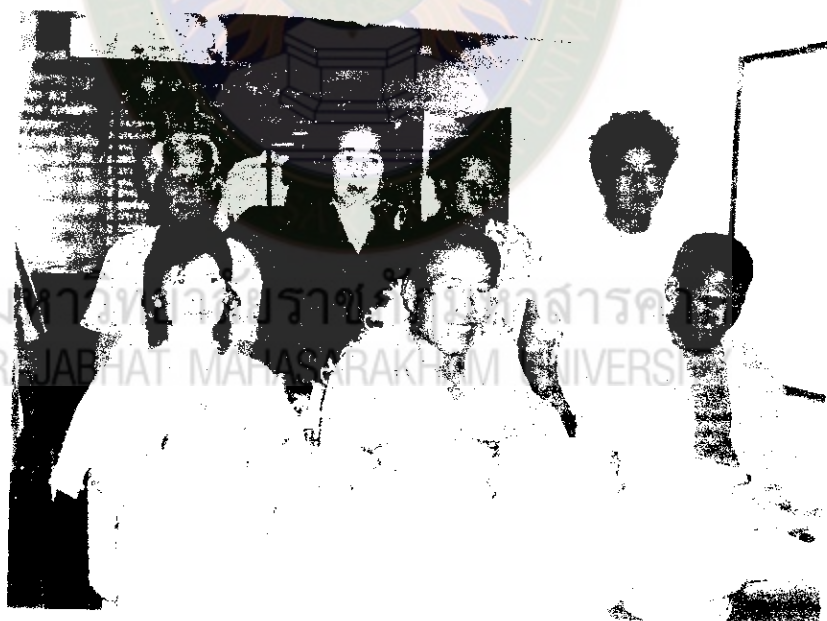
ภาพที่ 26 คณะกรรมการพร้อมด้วยผลิตภัณฑ์