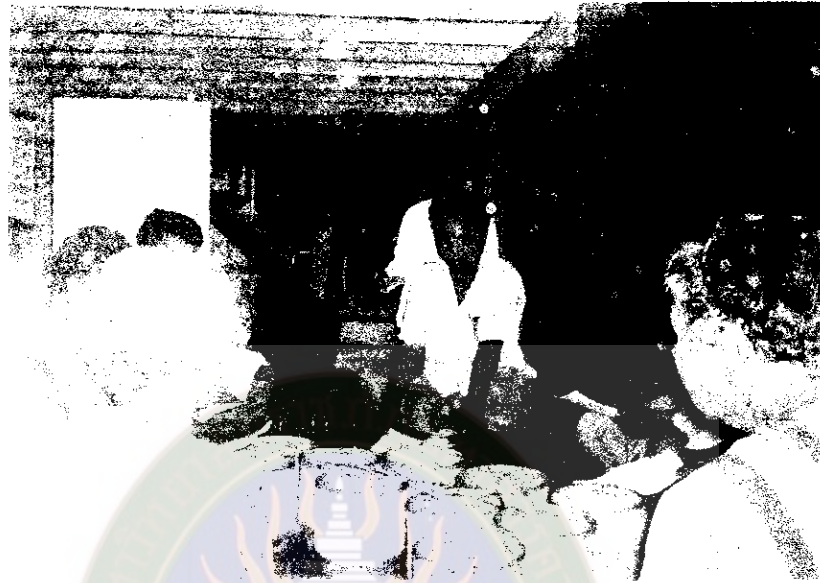
ภาพที่ 27 ผู้ช่วยและนักวิจัยชี้แจงความเข้าใจเบื้องต้น