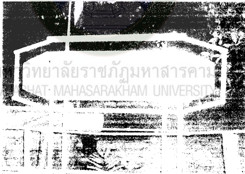
ภาพที่ 24 ที่ทำการผู้ใหญ่บ้าน (ประธานกลุ่ม)