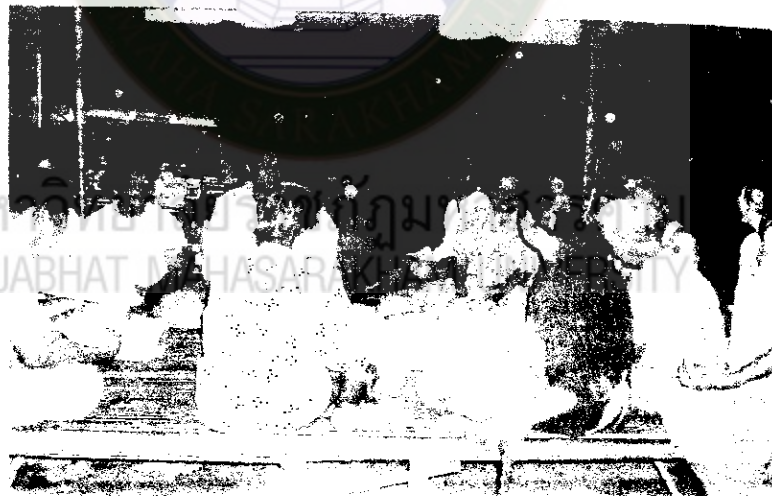
ภาพที่ 28 ผู้วิจัยสังเกตการณ์ประชุมกลุ่ม