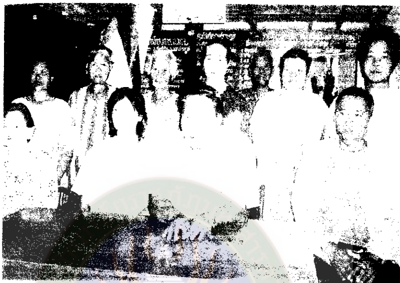
ภาพที่ 25 คณะกรรมการกลุ่ม