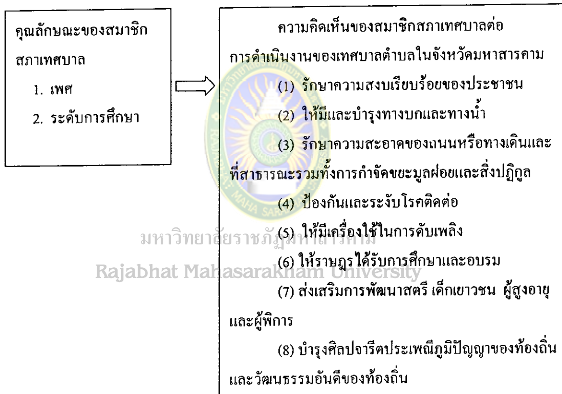
แผนภูมิที่ 3 กรอบแนวคิดในการวิจัยความคิดเห็นของสมาชิกเทศบาลต่อการดำเนินงานเทศบาลตำบลในจังหวัดมหาสารคาม

ตัวแปรอิสระ (Independent Variables) ตัวแปรตาม (dependent Variables)