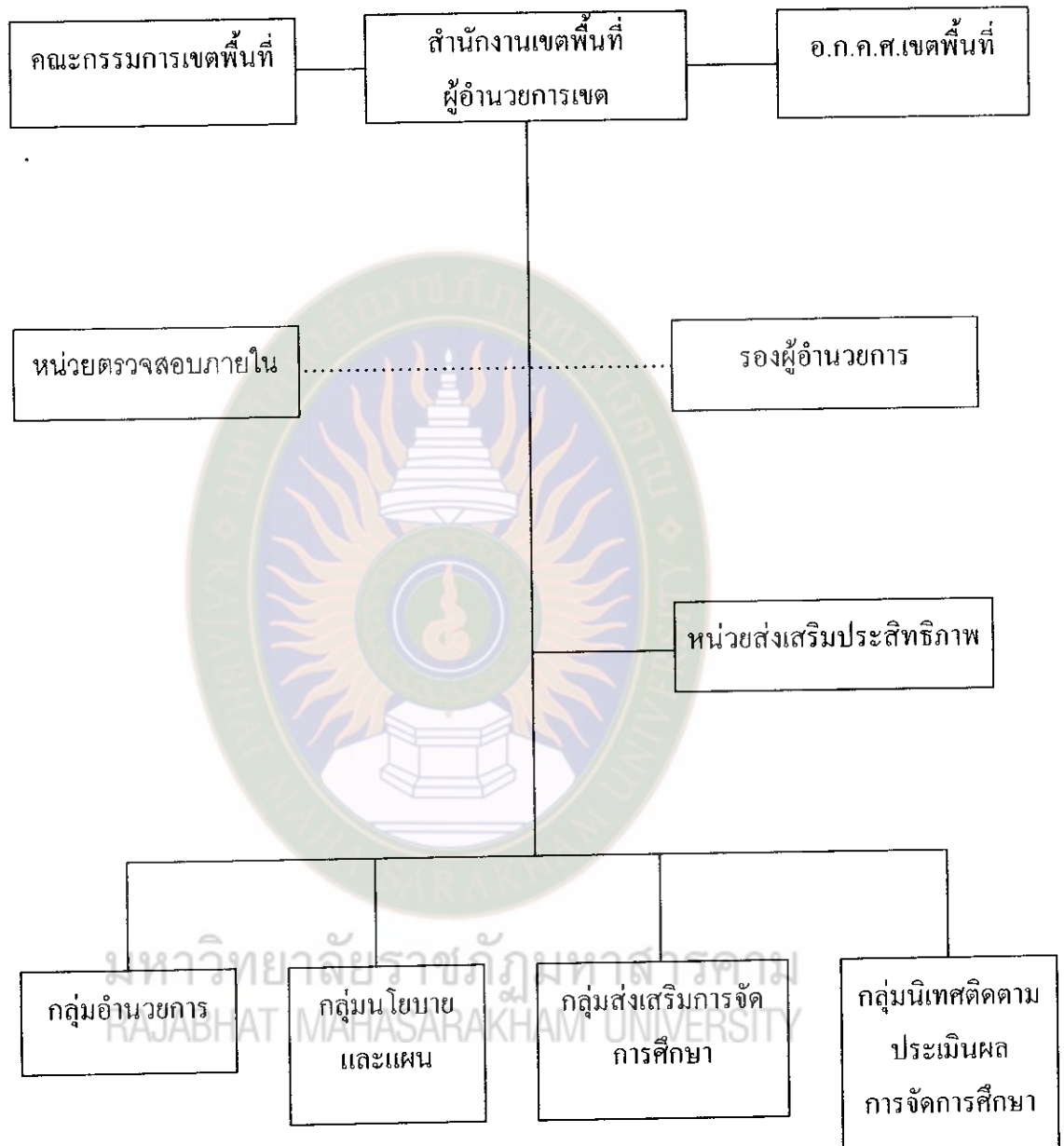
แผนภูมิที่ 4 การจัดองค์การของสำนักงานเขตพื้นที่การศึกษาหนองคาย เขต 2