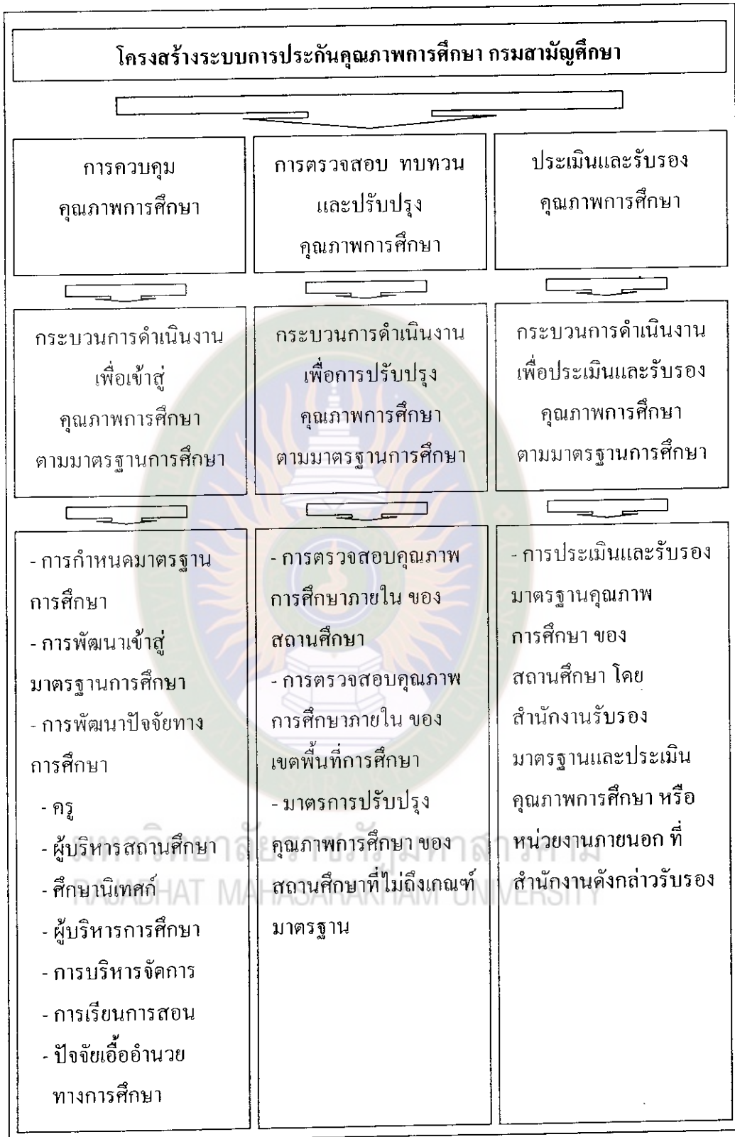
แผนภูมิที่ 2 แสดง โครงสร้างการประกันคุณภาพการศึกษา ของกรมสามัญศึกษา