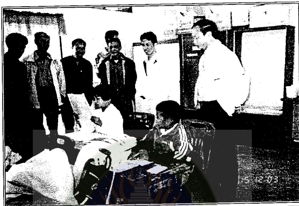
คณะผู้ประเมินคุณภาพภายนอก ผู้บริหาร คณะกรรมการสถานศึกษาขั้นพื้นฐาน ผู้นำชุมชนและผู้ปกครองนักเรียน ร่วมสังเกตและทดสอบทักษะ ความรู้ ความสามารถของนักเรียน เพื่อใช้เป็นข้อมูลในการประเมิน คุณภาพภายนอกตามเกณฑ์มาตรฐานการศึกษาแห่งชาติ