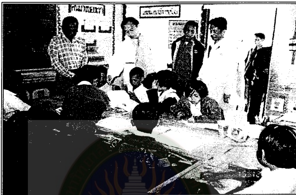
ประธานคณะกรรมการสถานศึกษาขั้นพื้นฐาน พร้อมคณะกรรมการ นำคณะผู้ประเมินภายนอกเยี่ยมชมชั้นเรียน เพื่อสังเกตการจัดกิจกรรม การเรียนการสอนและพฤติกรรมนักเรียน