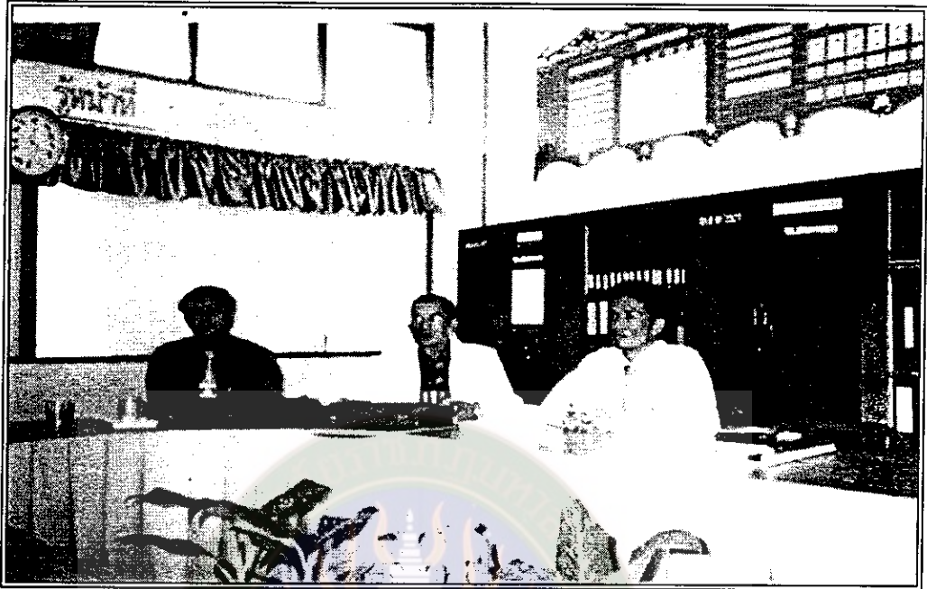
ผู้บริหาร คณะครู คณะกรรมการสถานศึกษาขั้นพื้นฐาน ผู้นำชุมชนและ ผู้ปกครองนักเรียนร่วมฟังสรุปผลการประเมินคุณภาพภายนอก ตามเกณฑ์มาตรฐานการศึกษาแห่งชาติ