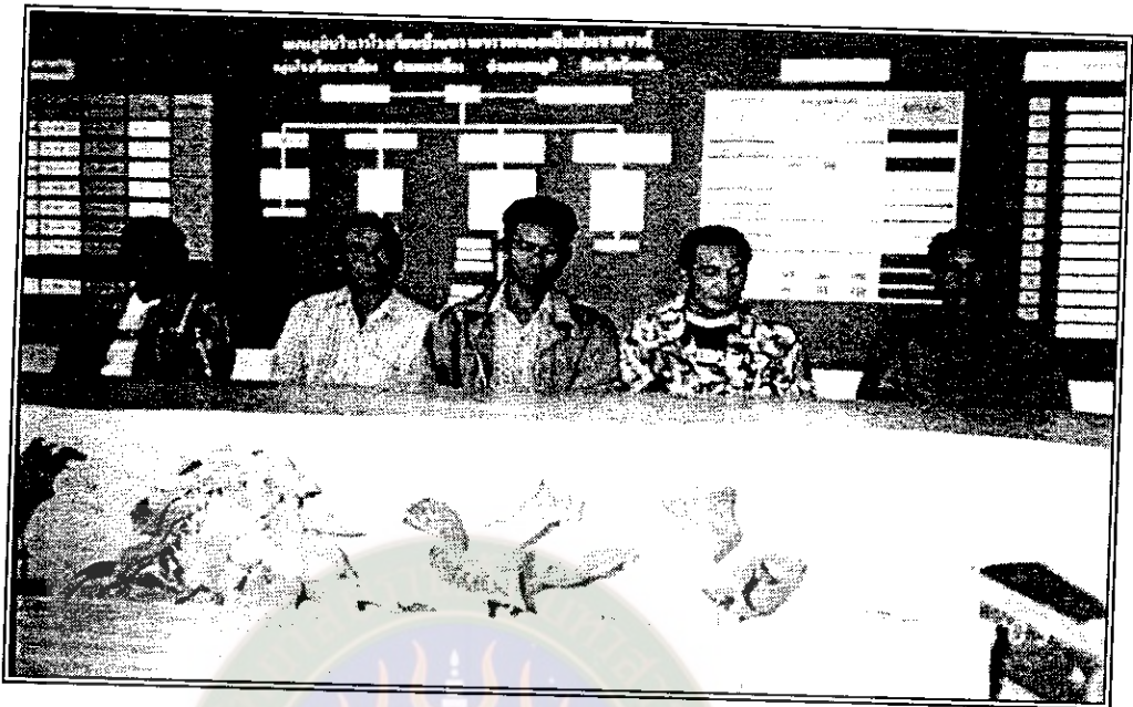
คณะผู้ประเมินคุณภาพภายนอก สำนักงานรับรองมาตรฐานและประเมินคุณภาพการศึกษา ได้ประชุมสรุปผลการประเมินคุณภาพภายนอกตามเกณฑ์มาตรฐานการศึกษาแห่งชาติ ให้ผู้บริหาร ครูผู้สอน คณะกรรมการสถานศึกษาขั้นพื้นฐาน ผู้นำชุมชนและผู้ปกครองนักเรียน