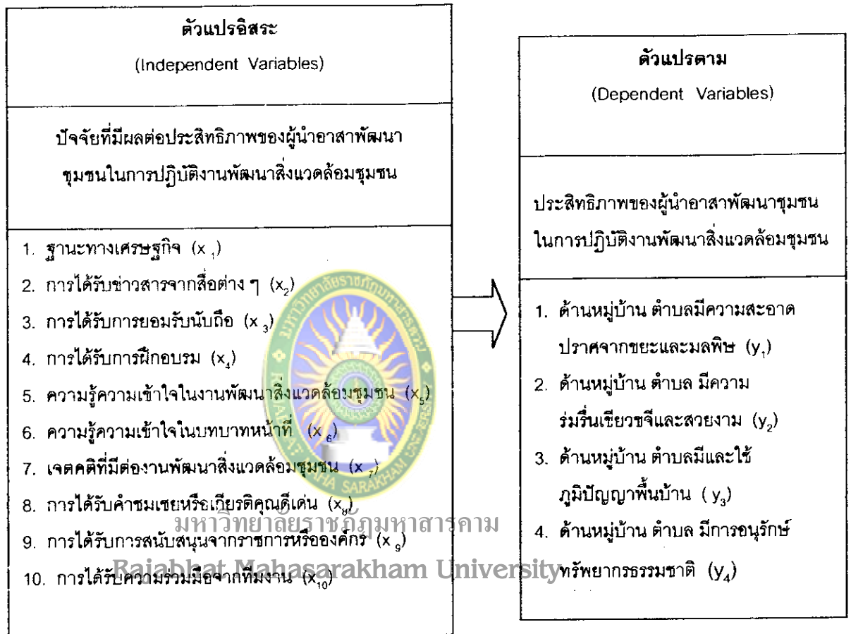
แผนภูมิที่ 3 กรอบแนวคิดในการวิจัย