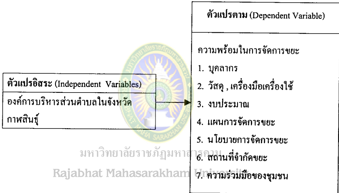
แผนภาพที่ 3 กรอบแนวความคิดในการวิจัย

ผู้วิจัยมีกรอบแนวความคิดในการศึกษาวิจัยในครั้งนี้ ดังต่อไปนี้คือ